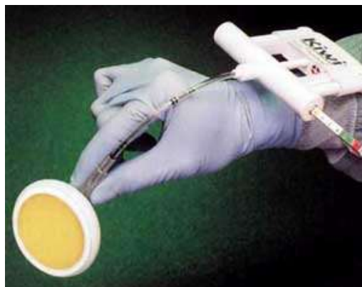
Figure 1 : Ventouse Kiwi

La ventouse Kiwi® est un instrument à usage unique constitué d'une pompe d'aspiration manuelle et d'un indicateur de traction. Ce système permet à l'opérateur de contrôler lui-même la dépression appliquée et la force de traction sans avoir recours à une tierce personne. Son diamètre est de 5cm soit une surface de 19,63 cm 2 , lorsque la dépression maximale est appliquée (800 millibars soit 0,8 kg/m 2 ). L'opérateur peut exercer une force de traction de 0,8 kg/m 2 X 19,63 cm 2 soit 15,7 kg. Si la traction exercée par l'obstétricien est supérieure à 15,7 kg, la ventouse lâche. Il s'agit de la ventouse utilisée depuis 2006 au CHU de Nancy.