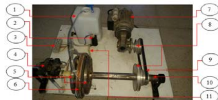
Figure 2 : La machine réalisée (1-Réservoir d'azote 2-Pompe 3- Alimentation des deux semi-induits 4- Système bagues-balais 5- Induit 6- Inducteur 7- Moteur d'entraînement 8- Réducteurs 9- Courroies 10- Axe de rotation 11- Alimentation de l'inducteur)

La machine réalisée est de type supraconductrice synchrone à flux axial à double entrefer. L'alimentation en courant alternatif des deux semi-induits tournants de la machine est assurée par un système de bagues-balais tandis que l'inducteur supraconducteur est fixe. Cela a permis la conception d'un système de refroidissement plus simple. L'inducteur est entièrement plongé dans de l'azote liquide.