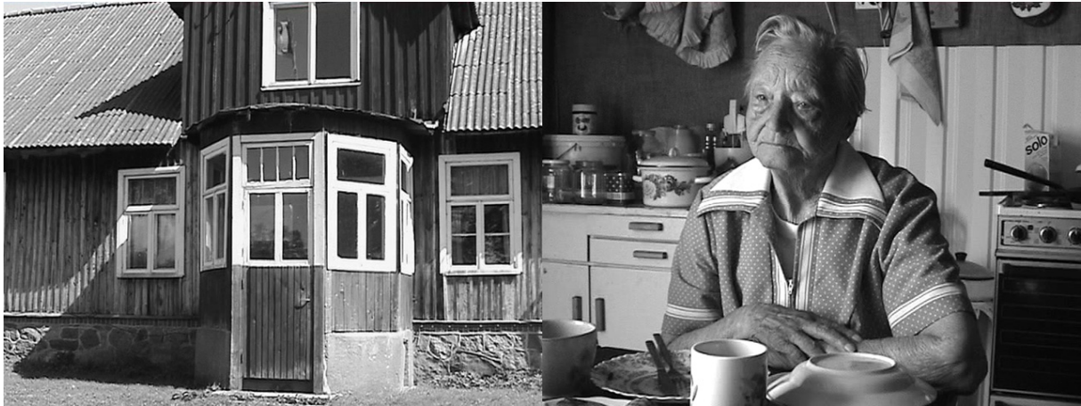
Fig.3 – Éléonore de Montesquiou, Minu maja on minu maa - My Home Is My Castle , vidéo noir et blanc, 38 min., 2001.