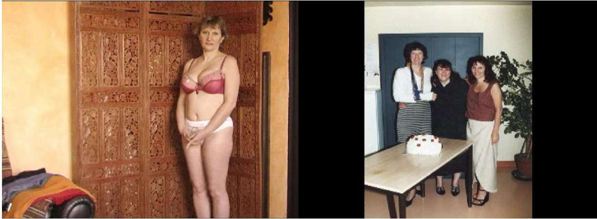
Fig. 2 – Justine Pluinage, Catherine , vidéo, 9 min. 41 sec., 2008.

portrait provoque un retournement de situation, proposant au voyeur de s'exhiber. L'artiste choisit d'accentuer ce dévoilement, jouant avec la dimension intrinsèque d'exhibition de soi, oubliant le voile pour découvrir toujours plus, plus de parole, plus de chair.