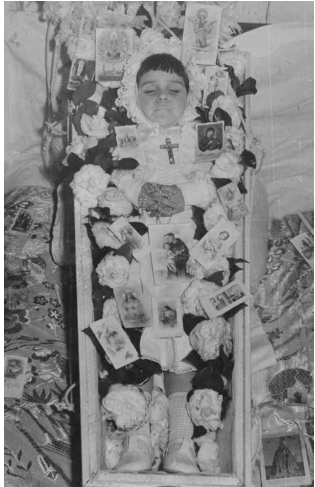
Foto 7. Anónimo. [Niño fallecido en su ataúd]. [Años 50]. Archivo gráfico del Museo de Pontevedra.

pacio sagrado se transforme en una ensoñación petrificante, un espacio duro y silencioso, cuya imagen aporta esa cálida intimidad que permite al familiar establecer esa presencia-ausencia. Sin embargo, todas las imágenes atraviesan los dos polos: el de la ausencia y el de la presencia que define el campo ontológico de la memoria, tal y como afirma Keenan. (1998, pp. 60-64)