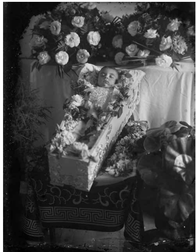
Foto 6. Pacheco. [Niño difunto]. s/f. archivo Pacheco. Concello de Vigo.