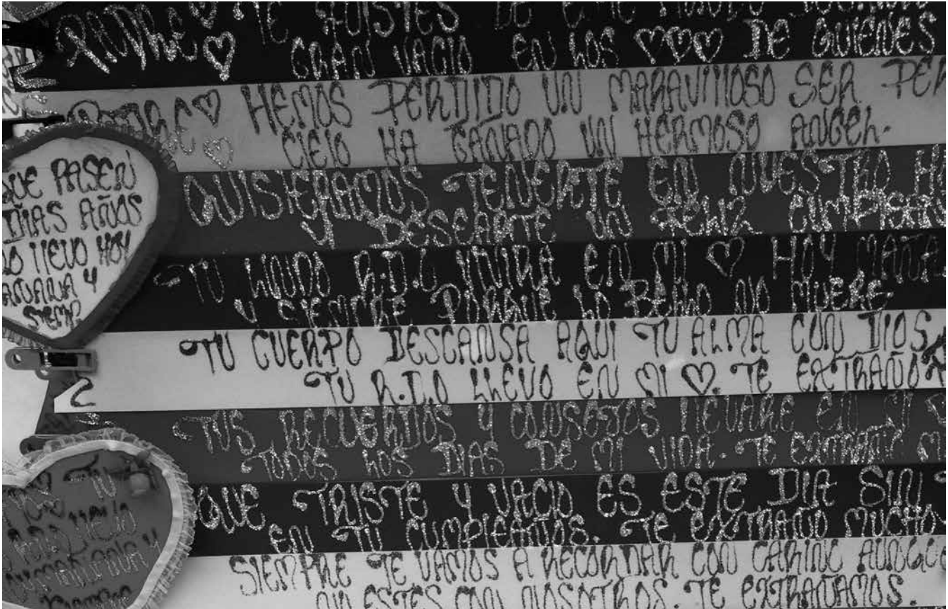
Foto 8. Fotografía de mensajes para lápidas. Bogotá. 2014.

lugar de memoria y memorístico, se convierte en la única posibilidad de luchar ante la pérdida del cuerpo, su desaparición definitiva que permanece en el tiempo como una herida; y se hace más profunda por la paulatina borradura de la imagen conservada en nuestra memoria. Gracias a la fotografía, esta tortura mental y emocional es solventada, en parte.