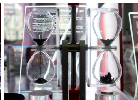
Le sablier magnétique. Dans le sablier de droite placé au-dessus d'un aimant, la poudre de fer s'aligne sur les lignes de champ.