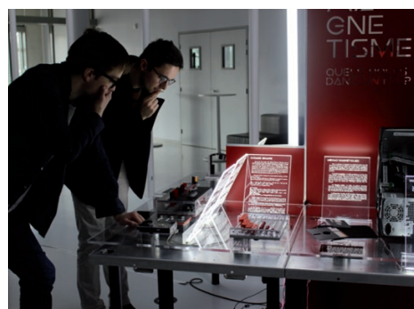
Vue d'ensemble de l'îlot IV, intitulé « MAGNÉTISME : quels rôles dans un PC ? »