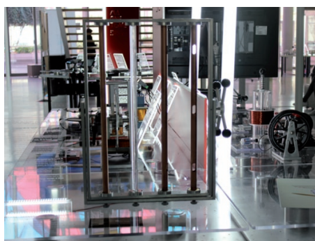
Vue d'ensemble de l'îlot III, intitulé « MAGNÉTISME : pour quoi faire ? »

ARTEM, comme ARt, TEchnologie et Management, est un campus interdisciplinaire d'un nouveau genre : il puise tout son sens de l'étymologie du terme latin ars, artis qui recouvrait un champ très vaste allant de la culture au talent, de la science au métier, de la connaissance à la production. ARTEM réunit l'École Nationale Supérieure d'Art et de Design de Nancy (l'ENSAD), Mines Nancy, et l'ICN Business School. Il est construit en écho au mouvement Art nouveau que fut (à la fin du 19 e et au début du 20 e siècle) l'École de Nancy, dont le but était de réconcilier art et industrie.