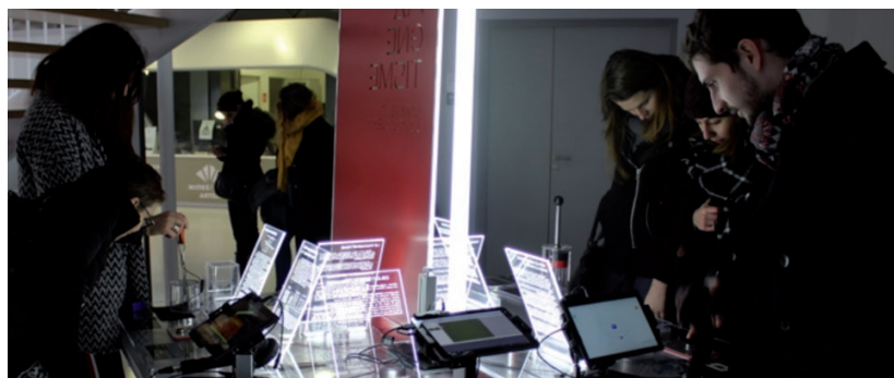
Vue d'ensemble de l'îlot II, intitulé « MAGNÉTISME : comment l'expliquer ? »