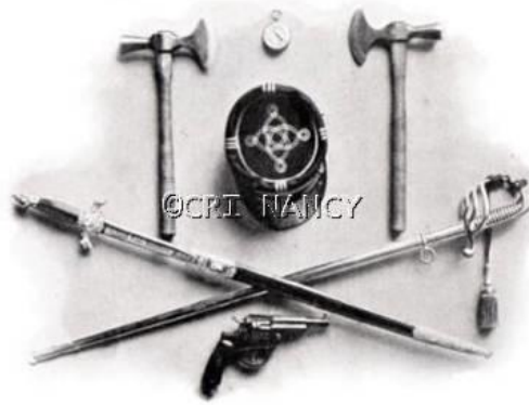
Équipement forestier (début XIXe siècle)

L'arrêté des consuls du 6 pluviôse an IX (26 janvier 1801) fixe le nombre, l'arrondissement et la résidence des agents forestiers. Au total, la France est divisée en 25 conservations 68 . L'arrêté du 4 ventôse an IX (25 février 1801) 69 complète celui du 6 pluviôse fixe la liste des conservateurs des forêts, ainsi que leur lieu de résidence et l'étendue de l'arrondissement forestier dépendant de chaque conservation 70 . Une circulaire du 1er germinal an IX (22 mars 1801) 71 précise qu'un garde particulier peut aisément surveiller seul jusqu'à 600 hectares de forêts en massif et au moins 250 hectares de bois épars 72 . De même, un garde général pouvant surveiller au moins 20 gardes particuliers, son ressort est donc fixé approximativement à 8500 hectares au plus lorsque les triages des gardes particuliers sont contigus et à la moitié dans l'autre cas, ce qui donne un moyen terme de 6375 hectares 73 .