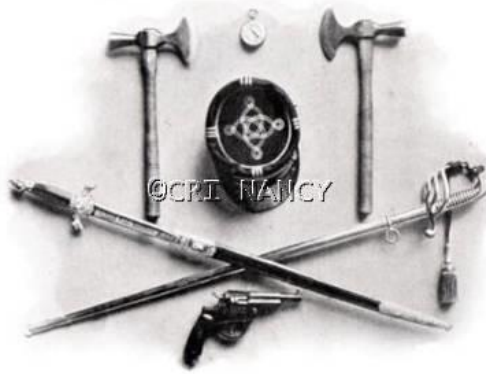
Équipement forestier (début XIXe siècle)

L'arrêté des consuls du 6 pluviôse an IX (26 janvier 1801) fixe le nombre, l'arrondissement et la résidence des agents forestiers. Au total, la France est divisée en 25 conservations 68 . L'arrêté du 4 ventôse an IX (25 février 1801) 69 complète celui du 6 pluviôse fixe la liste des conservateurs des forêts, ainsi que leur lieu de résidence et l'étendue de l'arrondissement forestier dépendant de chaque conservation 70 . Une circulaire du 1er germinal an IX (22 mars 1801) 71 précise qu'un garde particulier peut aisément surveiller seul jusqu'à 600 hectares de forêts en massif et au moins 250 hectares de bois épars 72 . De même, un garde général pouvant surveiller au moins 20 gardes particuliers, son ressort est donc fixé approximativement à 8500 hectares au plus lorsque les triages des gardes particuliers sont contigus et à la moitié dans l'autre cas, ce qui donne un moyen terme de 6375 hectares 73 .