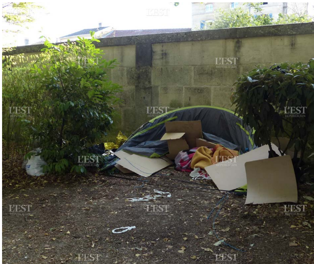
Annexe 1 : Exemple d'un « rassemblement » de tentes de migrants