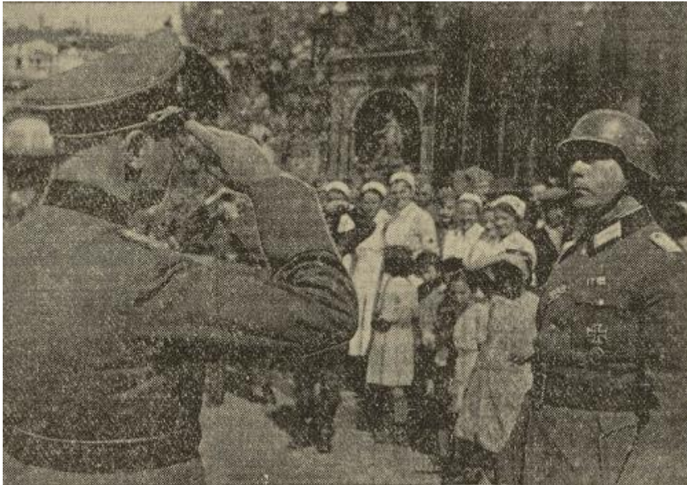
Le chef de la compagnie annonce l'arrivée du détachement et de la musique à Nancy le dimanche 1 er septembre 1940 (source : L'Écho de Nancy ).