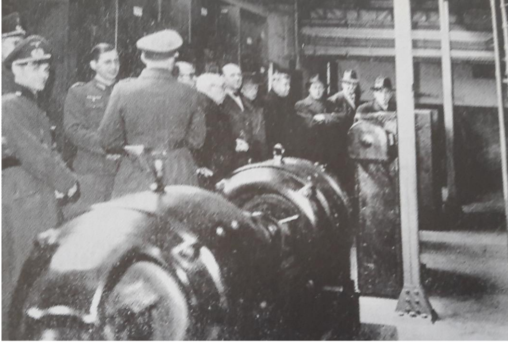
Une visite d'officiers allemands à l'imprimerie de L'Écho de Nancy.