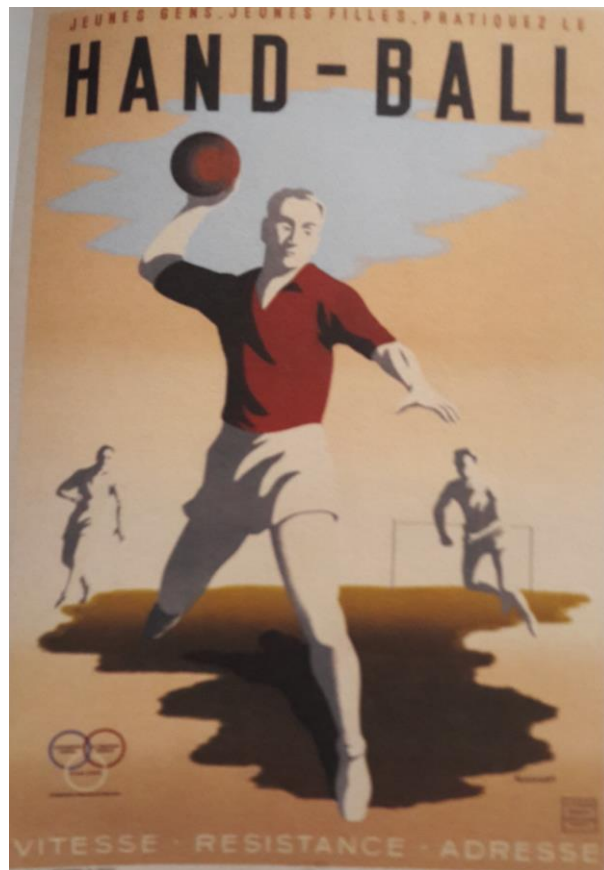
Affiche de propagande pour le Handball, création de Bernard Villemot pour le commissariat général à l'Éducation et aux Sports (source : DESPRAIRIES Cécile, L'héritage de Vichy, ces 100 mesures toujours en vigueur , Armand Colin, 2012, p. 195).