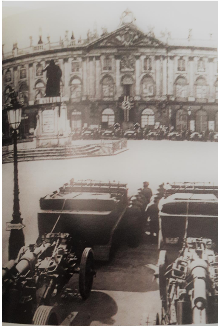
La place Stanislas lors de l'entrée des Allemands dans la ville de Nancy, le 16 juin 1940