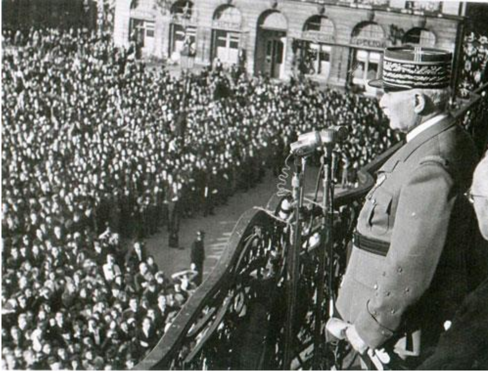
Visite du maréchal Pétain à Nancy, place Stanislas, le 26 mai 1944.