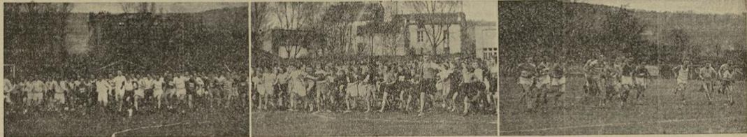
On voit sur cette bande photographique trois départs : dans l'ordre, départ des Jeunes Cadets, départ des Licenciés. Remarquez, au centre, combien les Fillettes sont pressées de s'élancer...