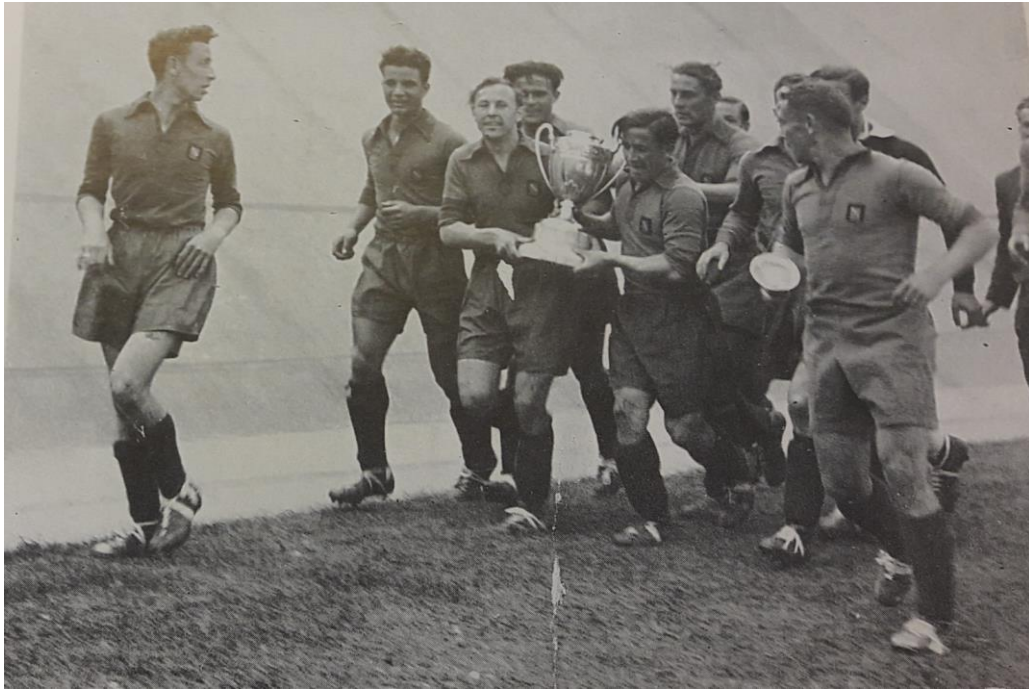
Tour d'honneur de l'équipe de Nancy-Lorraine, vainqueur de la Coupe de France 1944, le trophée « Charles Simon » entre les mains.