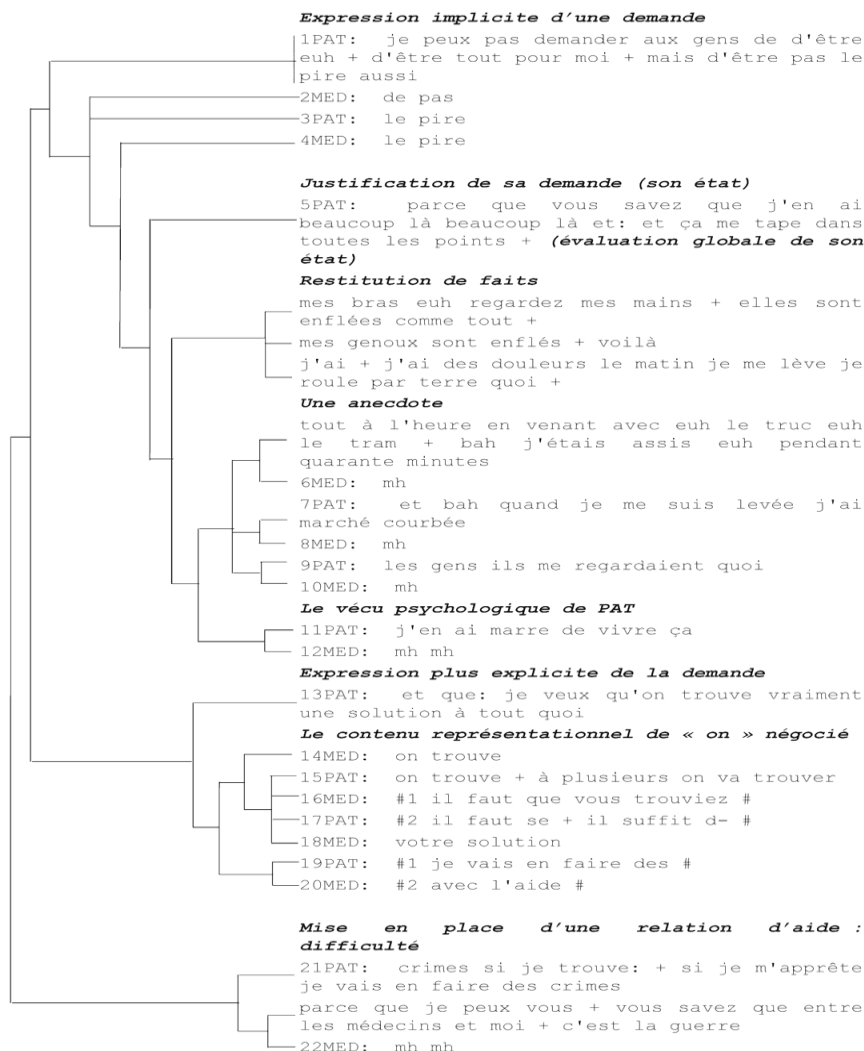
Figure 3 : Analyse hiérarchique de la séquence

Elle poursuit en expliquant que néanmoins elle a besoin d'aide, que son état physique et psychologique le requiert. Etudions plus finement cette séquence en question (v. fig [fig3]).