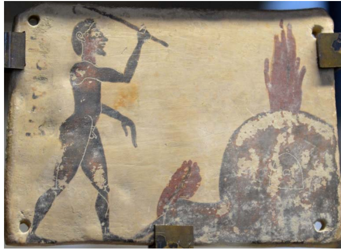
Figure 5 : Plaquette corinthienne de Penteskouphia, 575-550 av. J.-C. Louvre MNB 2858, face B : Potier et four.

Un fragment de pinax conservé à Berlin 19 montre une phase moins souvent illustrée, celle de la préparation de l'argile. Il fallait en effet la faire décanter, la fouler et la malaxer. Sur ce fragment, le personnage de gauche, âgé, torse nu, se tient à une corde afin de fouler l'argile avec ses pieds ; à droite, une femme, apparemment assise, malaxe dans ses mains une boule d'argile. La scène est rare : on connaît seulement deux autres occurrences de préparation de l'argile, sur deux skyphoi attiques attribués au Peintre de Thésée 20 , vers 500 avant J.-C.