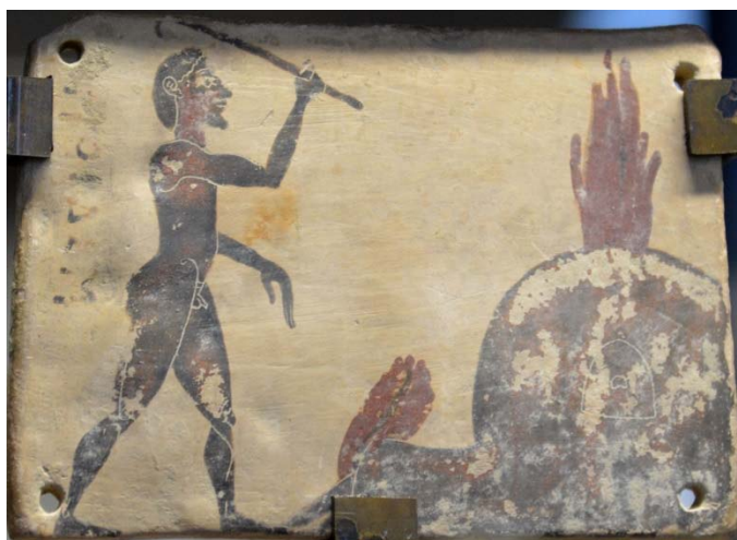
Figure 5 : Plaquette corinthienne de Penteskouphia, 575-550 av. J.-C. Louvre MNB 2858, face B : Potier et four.

Un fragment de pinax conservé à Berlin 19 montre une phase moins souvent illustrée, celle de la préparation de l'argile. Il fallait en effet la faire décanter, la fouler et la malaxer. Sur ce fragment, le personnage de gauche, âgé, torse nu, se tient à une corde afin de fouler l'argile avec ses pieds ; à droite, une femme, apparemment assise, malaxe dans ses mains une boule d'argile. La scène est rare : on connaît seulement deux autres occurrences de préparation de l'argile, sur deux skyphoi attiques attribués au Peintre de Thésée 20 , vers 500 avant J.-C.