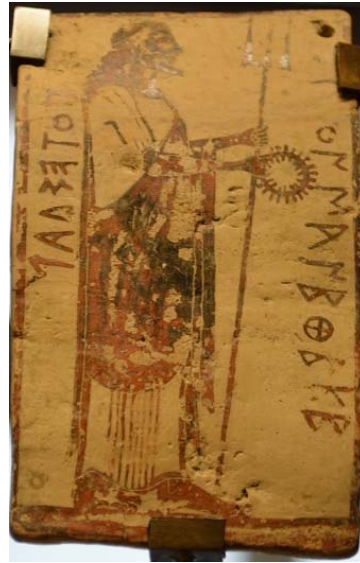
Figure 1 : Plaquette corinthienne de Penteskouphia, 575-550 av. J.-C. Louvre MNB 2856, face A : Poséidon.

C'est ce qui ressort notamment de la plaquette MNB 2856 du Louvre 10 , datable de la période 575-550 av. J.-C., dont la face A (Fig. 1), décorée dans le sens de la hauteur, porte une représentation de Poséidon, debout vers la droite, tenant son trident de la main gauche et une couronne de la main droite, tandis que la face B (Fig. 2), décorée dans le sens de la longueur, montre un homme nu s'activant auprès d'un four de potier, dont il remue le feu par l'ouverture inférieure.