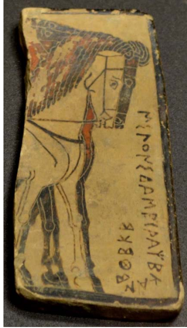
Figure 3 : Plaquette corinthienne fragmentaire de Penteskouphia, 575-550 av. J.-C. Louvre MNC 212 : quadriga et signature-dédicace.

Les différentes phases sont détaillées à plusieurs reprises sur ces pinakes , tout au long des quelque 125 années que dura leur production.