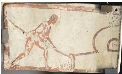
Fig. 2 : Plaquette corinthienne de Penteskouphia, 575-550 av. J.-C. Louvre MNB 2856, face B : four de potier.

Le sujet, l'emplacement des trous de suspension, les inscriptions (à gauche du dieu, dans le sens rétrograde, son nom, partiellement en alphabet corinthien, ΠΟΤΕΙΔΑΝ, et, à droite, la dédicace ΙΓΡΟΝΜΑΝΕΘΕΚΕ, « Igron m'a consacré » 11 ) montrent bien que cette face que les modernes désignent comme face A était, pour le peintre aussi, la principale et que l'on a affaire à un ex-voto. Mais le revers, précisément parce qu'il s'inscrit dans un registre très différent, est nécessairement en rapport avec l'image culturelle : Igron, le mystérieux dédicant de ce pinax , a toutes chances d'avoir été un céramiste (probablement maître d'atelier) désireux de placer son activité sous la protection du dieu et/ou de le remercier de lui avoir apporté la prospérité. La dédicace du peintre Milonidas, sur un autre fragment provenant de Penteskouphia et à peu près contemporain, Louvre MNC 212 (Fig. 3) 12 , constitue un argument décisif dans ce sens : devant les chevaux partiellement conservés d'un quadriges où se tenaient sans doute Poséidon et Amphitrite, le peintre a écrit, en alphabet corinthien, ΜΙΛΟΝΙΔΑΣΕΓΡΑΨΕΚΑΝΕΘΕΚΕ, « Milonidas a peint et a consacré ».