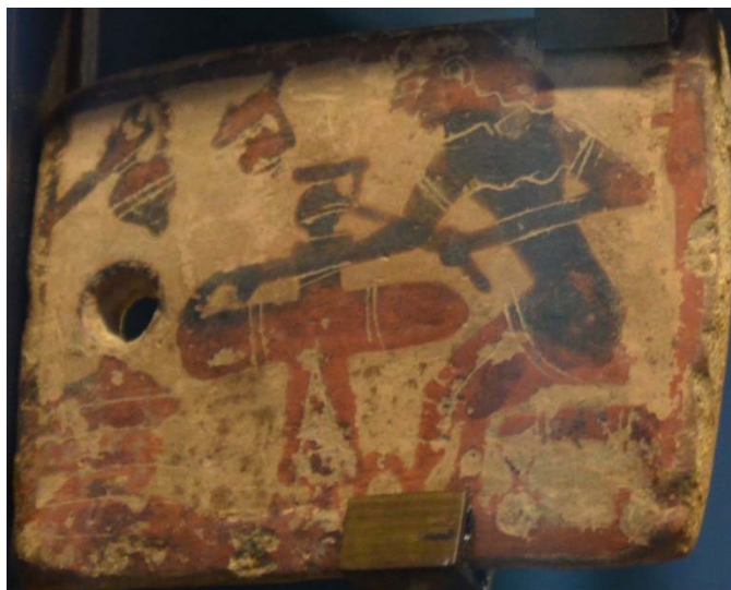
Figure 6 : Plaquette corinthienne de Penteskouphia, 625-600 av. J.-C. Louvre MNB 2857, face A : Potier à son tour.

Les documents issus de la céramique attique sont très différents. Aucun dépôt comparable à celui de Penteskouphia n'a été découvert et il ne semble pas que les potiers et patrons d'atelier athéniens aient eu un sanctuaire où ils auraient concentré leurs offrandes à telle ou telle divinité – même pas à Athéna. On a certes trouvé sur l'Acropole des dédicaces de potiers se désignant en tant que tels, mais elles accompagnaient des statues 25 (perdus pour nous), même lorsqu'il s'agissait de consacrer la dîme de leur activité : c'est ce qu'a fait un certain Peikon, vers 490 avant J.-C. 26 , ou encore Euphronios, à la fin de sa carrière, quand il était probablement devenu patron d'atelier 27 . On mentionnera également le relief sculpté de la fin du VI e siècle, représentant un potier assis, deux coupes à la main 28 – la référence à son activité, et même à sa spécialité, est claire, mais il n'est pas