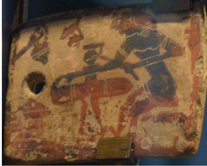
Figure 6 : Plaquette corinthienne de Penteskouphia, 625-600 av. J.-C. Louvre MNB 2857, face A : Potier à son tour.

Les documents issus de la céramique attique sont très différents. Aucun dépôt comparable à celui de Penteskouphia n'a été découvert et il ne semble pas que les potiers et patrons d'atelier athéniens aient eu un sanctuaire où ils auraient concentré leurs offrandes à telle ou telle divinité – même pas à Athéna. On a certes trouvé sur l'Acropole des dédicaces de potiers se désignant en tant que tels, mais elles accompagnaient des statues 25 (perdus pour nous), même lorsqu'il s'agissait de consacrer la dîme de leur activité : c'est ce qu'a fait un certain Peikon, vers 490 avant J.-C. 26 , ou encore Euphronios, à la fin de sa carrière, quand il était probablement devenu patron d'atelier 27 . On mentionnera également le relief sculpté de la fin du VI e siècle, représentant un potier assis, deux coupes à la main 28 – la référence à son activité, et même à sa spécialité, est claire, mais il n'est pas