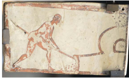
Fig. 2 : Plaquette corinthienne de Penteskouphia, 575-550 av. J.-C. Louvre MNB 2856, face B : four de potier.

Le sujet, l'emplacement des trous de suspension, les inscriptions (à gauche du dieu, dans le sens rétrograde, son nom, partiellement en alphabet corinthien, ΠΟΤΕΙΔΑΝ, et, à droite, la dédicace ΙΓΡΟΝΜΑΝΕΘΕΚΕ, « Igron m'a consacré » 11 ) montrent bien que cette face que les modernes désignent comme face A était, pour le peintre aussi, la principale et que l'on a affaire à un ex-voto. Mais le revers, précisément parce qu'il s'inscrit dans un registre très différent, est nécessairement en rapport avec l'image culturelle : Igron, le mystérieux dédicant de ce pinax , a toutes chances d'avoir été un céramiste (probablement maître d'atelier) désireux de placer son activité sous la protection du dieu et/ou de le remercier de lui avoir apporté la prospérité. La dédicace du peintre Milonidas, sur un autre fragment provenant de Penteskouphia et à peu près contemporain, Louvre MNC 212 (Fig. 3) 12 , constitue un argument décisif dans ce sens : devant les chevaux partiellement conservés d'un quadriges où se tenaient sans doute Poséidon et Amphitrite, le peintre a écrit, en alphabet corinthien, ΜΙΛΟΝΙΔΑΣΕΓΡΑΨΕΚΑΝΕΘΕΚΕ, « Milonidas a peint et a consacré ».