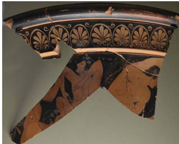
Figure 8 : Fragment de cratère, signé d'Euphronios peintre, vers 515-510 av. J.-C. Louvre G 110.

Euphronios, dans cette première phase de sa carrière, « a signé comme peintre près du tiers des œuvres conservées qui lui sont attribuées 25 », non sans fierté, comme sur le cratère, aujourd'hui très fragmentaire, Louvre G 110 (Fig. 8), vers 515-510, où on a pu lire Euphron(ios) egraphsen tade 26 , « ceci, c'est Euphronios qui l'a peint ».