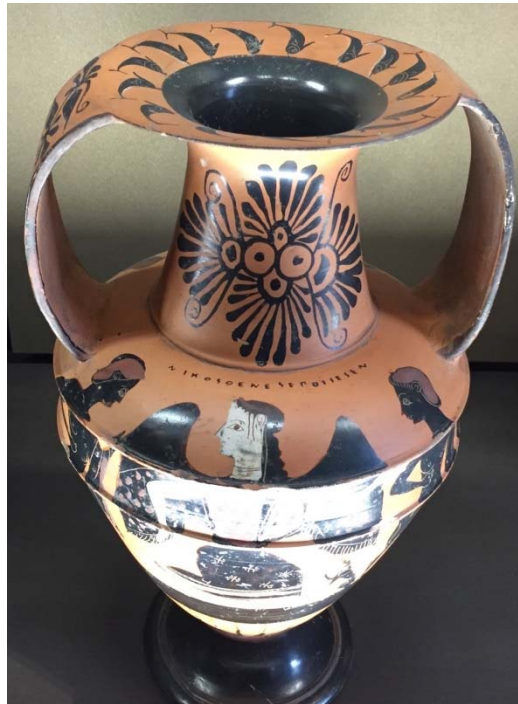
Figure 7 : Amphore « nicosthénienne », attribuée au Peintre N, vers 530-520 av. J.-C. Louvre F 102.

devenir maître d'atelier ? Et le patron n'était-il pas, à sa façon, un peu auteur lui aussi ? On sait que la cuisson des vases était une opération très délicate, qui revenait précisément au patron de l'atelier, et on aurait tort, sans doute, de ramener les préoccupations de ce dernier à la seule productivité. Cela dit, Nikosthénès devait être à la tête d'une entreprise comprenant plusieurs ateliers, et il est peu probable que, au sommet de sa réussite, il ait enfourné lui-même tous les vases qui portent son nom, ou plutôt sa marque. Mais son cas n'était certainement pas le plus courant et il ne faudrait pas généraliser l'interprétation de epoiesen comme « a fabriqué », au sens d'une estampille.