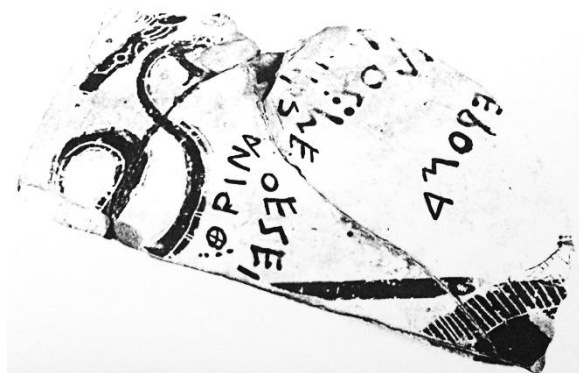
Figure 4 : Fragment Athènes MN 15918, avec les restitutions proposées.

C'est avec son successeur Clitias (Kleitias), bien meilleur peintre mais moins novateur, que les deux signatures apparaissent pour la