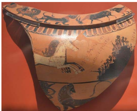
Figure 2 : Dinos de Pharsale, par Sophilos, vers 580 av. J.-C. Les jeux funéraires en l'honneur de Patrocle. Athènes, Musée National 15499.

époque, c'est un novateur, qui n'hésite pas à créer des thèmes nouveaux et à imaginer des compositions audacieuses – le cortège divin pour les Noces de Thétis et Pélée, les Jeux funéraires en l'honneur de Patrocle (Fig. 2), deux épisodes de la geste d'Achille que le peintre Clitias reprendra sur son célèbre Vase François.