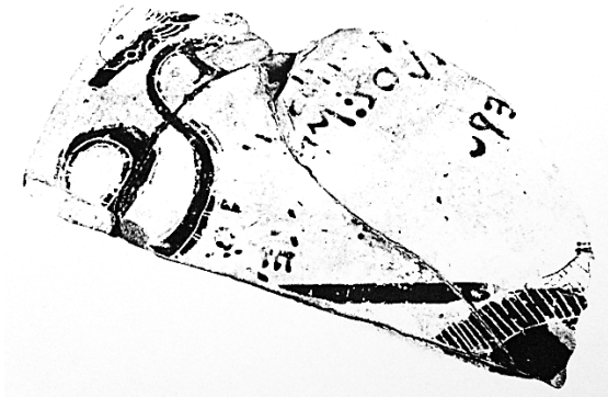
Figure 3 : Fragment d'un loutériorion de Sophilos, vers 580 av. J.-C. Athènes, Musée National 15918.

ailleurs au moins un autre loutériorion décoré par Sophilos, consacré sur l'Acropole – mais très fragmentaire et la signature qu'il portait peut-être ne s'est pas conservée. Impossible donc de savoir si Sophilos pouvait être tantôt seulement peintre, tantôt à la fois potier et peintre ; impossible de savoir s'il a employé mepoese dans son sens le plus neutre (« m'a fait », « m'a créé ») ou dans un sens global (Sophilos « m'a fait complètement »). La seule chose que l'on puisse dire est que le loutériorion en question n'est pas antérieur aux autres vases signés.