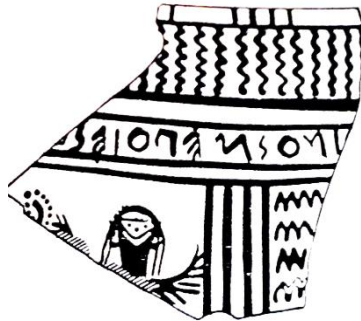
Figure 1 : Fragment de Pithécusses, vers 700 av. J.-C.

La plus ancienne signature connue à ce jour est conservée sur un fragment de cratère produit, vers 700 avant J.-C., dans la colonie eubéenne de Pithécusses, sur l'île d'Ischia (Fig. 1) 3 ; on y lit, de droite à gauche, inosmepoiese , soit « -inos (le nom du céramiste étant incomplet) m'a fait », avec, devant la forme verbale, le pronom personnel de première personne à l'accusatif, faisant ainsi parler le vase (ou bien la sirène qui semble être représentée en dessous). On voit là en général une signature « de potier », en raison de l'emploi du verbe poiein , « faire », et non du verbe graphein , « peindre, dessiner, écrire » – on se fonde toutefois pour cela sur un usage ultérieur, voire une spécialisation de ces deux verbes, alors que le second n'est pas encore attesté à cette date dans un tel emploi. Il est vrai que le dessin, partiellement conservé, peut nous apparaître comme très sommaire ; mais ce n'était pas le cas pour l'époque – celle du style géométrique, qui développait, au Géométrique Récent, un dessin conceptuel. On relèvera en outre que cette inscription a été peinte, comme d'ailleurs les suivantes. L'auteur ici nommé pourrait donc tout aussi bien être le peintre.