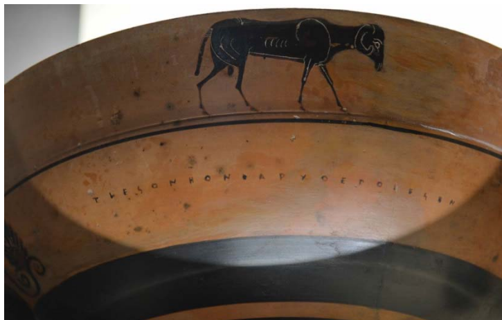
Figure 6 : Coupe à lèvres, par le potier Tlèson, vers 540 av. J.-C. Louvre F 86.

Plus généralement, et comme F. Villard l'a relevé 18 , de 570 à 520 environ, epoiesen domine largement. Mais c'est dû, en grande partie, à l'abondance des coupes dites des Petits Maîtres, sur lesquelles l'écriture peut constituer l'essentiel du décor, avec un grand nombre de signatures, et qui sont presque uniquement du type epoiesen . Pieter Heesen 19 en a fait le décompte : sur 545 inscriptions peintes sur des coupes à lèvres, 358 sont des signatures du type epoiesen (sur 209 coupes différentes – la même inscription figurant souvent sur les deux faces, comme c'est le cas de la coupe de Tlèson illustrée sur la Fig. 6) contre 8 seulement du type egrapsen (sur 7 coupes différentes) ; pour les coupes à bande, 95 signatures du type epoiesen (sur 64 coupes différentes) et 1 seule du type egrapsen sur un total de 129 inscriptions.