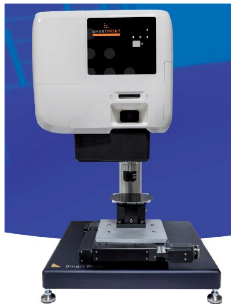
Tabletop tool for maskless and single shot photolithography