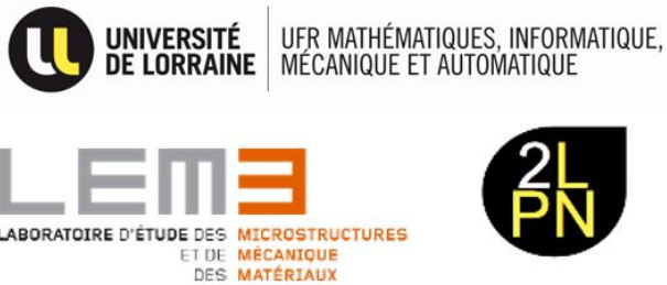
Figure 3. ENSEMBLE DES PARTENAIRES DU PROJET TINA- M2P

Le financement est pour une part assuré par la Fondation de l'Académie des Technologies et le programme LUE (Lorraine Université d'Excellence) TeachInnov de l'Université de Lorraine. La seconde part est abondée par le Plan d'Investissement d'Avenir (PIA1) dans le cadre d'un projet monté et coordonné par l'IRT M2P, un centre de transfert de technologies. En termes de recherche et de pédagogie, TINA M2P s'appuie sur les compétences d'enseignants-chercheurs du LEM3 et du 2LPN, deux laboratoires de l'Université de Lorraine.