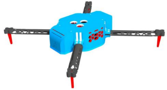
Figure 1. PRIMO CONCEPTION D'UN DRONE PARAMÉTRABLE, DJENIA (2008), HANNANE (2008)

de la CAO, l'ingénierie système, la fabrication additive, le choix des matériaux, utilisation de la plateforme 3DEXPERIENCE.