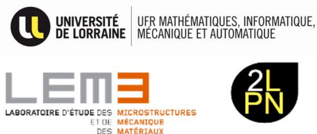
Figure 3. ENSEMBLE DES PARTENAIRES DU PROJET TINA- M2P

Le financement est pour une part assuré par la Fondation de l'Académie des Technologies et le programme LUE (Lorraine Université d'Excellence) TeachInnov de l'Université de Lorraine. La seconde part est abondée par le Plan d'Investissement d'Avenir (PIA1) dans le cadre d'un projet monté et coordonné par l'IRT M2P, un centre de transfert de technologies. En termes de recherche et de pédagogie, TINA M2P s'appuie sur les compétences d'enseignants-chercheurs du LEM3 et du 2LPN, deux laboratoires de l'Université de Lorraine.