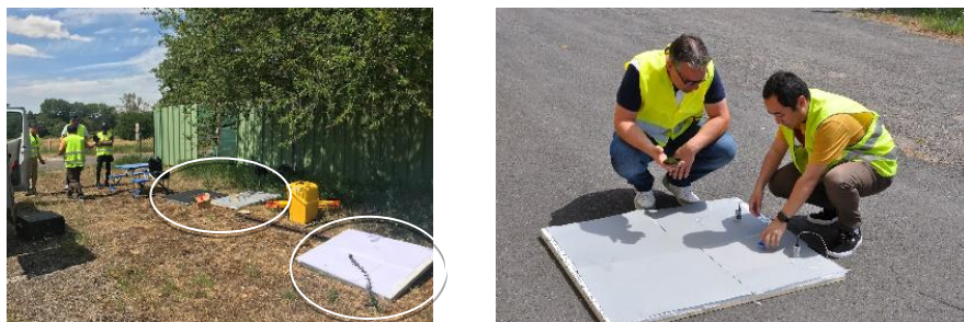
Figure 2. A gauche : les 2 ellipses blanches entourent les 3 cibles thermiques en polystyrène posées au sol (cible blanche, cible noire et cible grise) ; à droite : cible grise avec sonde Tynitag . Photographies prises lors de la mission drone du 8 juillet 2019 (Carré de l'Escadron, sur le Plateau de Frescaty).