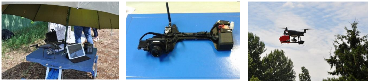
Figure 1. Dispositif d'acquisition d'images thermiques infrarouges. De gauche à droite : le drone, la tablette Ipad et les batteries ; la nacelle avec la caméra thermique ; le drone en vol avec la nacelle et la caméra thermique « sous abri ». Photographies prises lors de la mission drone du 8 juillet 2019 (Carré de l'Escadron, sur le Plateau de Frescaty).

Notre dispositif d'acquisition d'images thermiques infrarouges est composé d'un drone DJI Phantom 4 Pro (aéronef quadricoptère généralement utilisé pour des applications en imagerie optique) et d'une caméra thermique FLIR Vue Pro 336, 35°FOV, 9 mm, 30Hz utilisée couramment pour le diagnostic thermique (Figure 1). La plage de températures de fonctionnement de cette caméra s'étend de -20 °C à +50 °C et sa bande spectrale se situe entre 7,5 et 13,5 \mu\text{m} (caméra dite à ondes longues). Différents outils et logiciels dédiés au paramétrage du vol et de la caméra sont utilisés lors de la mission : DJI Go 4 (gestion de vol et paramétrage drone), Pix 4D Capture (gestion de vol et paramétrage drone en scénario S1, S2 et S3), FLIR Tools (gestion, paramétrage, exploitation des données issues de la caméra thermique), FLIR UAS (paramétrage caméra thermique), une tablette Ipad servant d'écran de contrôle, Photoscan Pro (post-traitement photogrammétrie).