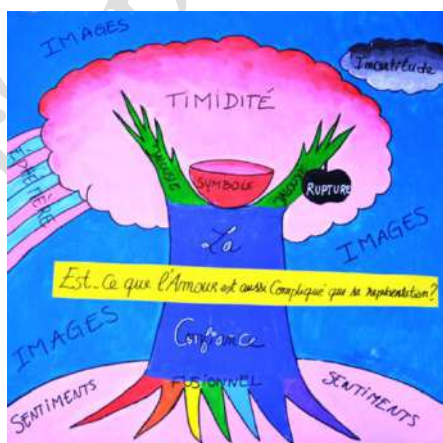
Figure 1 : Création graphique composée après discussion collective à partir de l'œuvre Vive l'Amour et autour de la question collective Est-ce que l'amour est aussi compliqué que sa représentation ?

A partir de la question (Est-ce que l'amour est aussi compliqué que sa représentation ?) retenue suite à la cueillette, la communauté de recherche a discuté et extrait certains concepts : sentiments, timidité, confiance, incertitude, éphémère. Puis, lors de la phase de retour à l'image, furent sélectionnés certains fragments picturaux présents dans l'œuvre initiale de Saint-Phalle : tronc, feuille, ciel. La mise en correspondance de chaque idée/concept avec un fragment