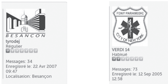
Figure 6 : L'appartenance géographique des locuteurs à un milieu médical précis

D'autres locuteurs préfèrent affirmer leur appartenance à un milieu professionnel particulier en précisant leur lieu de travail. Il s'agit alors d'un acte ayant pour objectif de légitimer le discours numérique en « s'octroyant une position institutionnelle et marquant son rapport à un savoir » (Amossy 2002 : 239). C'est le cas des exemples présentés ci-dessous :