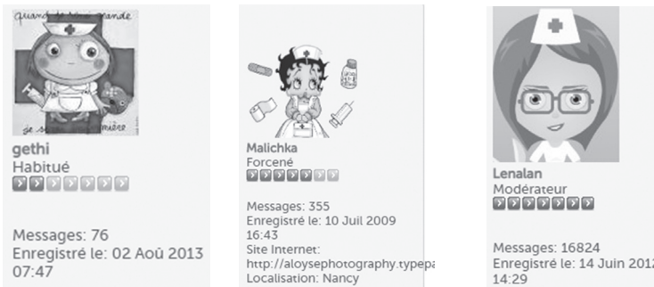
Figure 4 : L'appartenance professionnelle des locuteurs au monde médical

Il s'agit souvent de mettre des images ou des logos qui indiquent l'appartenance du locuteur au monde médical. Pour réussir son discours, le participant doit afficher ses qualités professionnelles « sur un mode généralement implicite » (Kerbrat-Orecchioni 2002 : 42). C'est le cas des exemples suivants où les locutrices ont choisi de mettre une image d'infirmière :