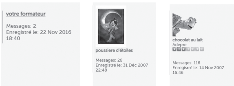
Figure 3 : Exemples de certains locuteurs utilisant des noms communs

Dans la deuxième forme du pseudonyme, on constate la présence des éléments langagiers auxquels le locuteur ajoute des signes typographiques (ex : €, _ , - , @, etc.) comme dans les exemples suivants : @tchoum , M@N@ , S@ndy , etc. Une telle forme adoptée montre l'impact du support numérique sur le choix de pseudonyme en vue de marquer sa différence par rapport aux autres locuteurs professionnels. Dans la troisième forme, les locuteurs choisissent des noms communs (ex : neigeeternelle , Escargot Bleu , l'agitateur , madouce , etc.) visant à se distinguer par rapport aux autres participants comme c'est le cas des exemples suivants :