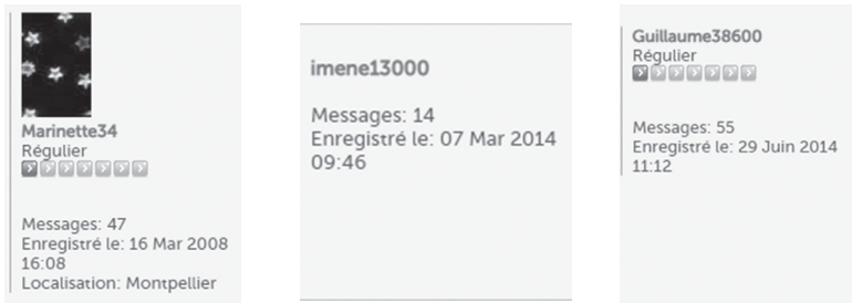
Figure 2 : Exemples de certains pseudonymes marquant la localisation géographique de leurs locuteurs

Dans la deuxième forme du pseudonyme, on constate la présence des éléments langagiers auxquels le locuteur ajoute des signes typographiques (ex : €, _ , - , @, etc.) comme dans les exemples suivants : @tchoum , M@N@ , S@ndy , etc. Une telle forme adoptée montre l'impact du support numérique sur le choix de pseudonyme en vue de marquer sa différence par rapport aux autres locuteurs professionnels. Dans la troisième forme, les locuteurs choisissent des noms communs (ex : neigeeternelle , Escargot Bleu , l'agitateur , madouce , etc.) visant à se distinguer par rapport aux autres participants comme c'est le cas des exemples suivants :