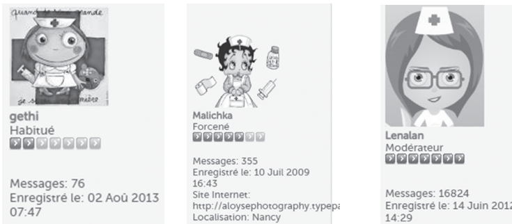
Figure 4 : L'appartenance professionnelle des locuteurs au monde médical

Il s'agit souvent de mettre des images ou des logos qui indiquent l'appartenance du locuteur au monde médical. Pour réussir son discours, le participant doit afficher ses qualités professionnelles « sur un mode généralement implicite » (Kerbrat-Orecchioni 2002 : 42). C'est le cas des exemples suivants où les locutrices ont choisi de mettre une image d'infirmière :