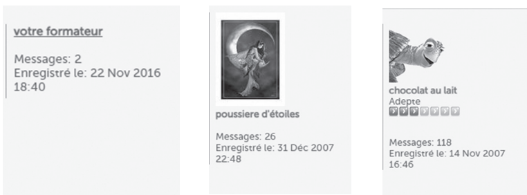
Figure 3 : Exemples de certains locuteurs utilisant des noms communs

Dans la deuxième forme du pseudonyme, on constate la présence des éléments langagiers auxquels le locuteur ajoute des signes typographiques (ex : €, _ , - , @, etc.) comme dans les exemples suivants : @tchoum , M@N@ , S@ndy , etc. Une telle forme adoptée montre l'impact du support numérique sur le choix de pseudonyme en vue de marquer sa différence par rapport aux autres locuteurs professionnels. Dans la troisième forme, les locuteurs choisissent des noms communs (ex : neigeeternelle , Escargot Bleu , l'agitateur , madouce , etc.) visant à se distinguer par rapport aux autres participants comme c'est le cas des exemples suivants :