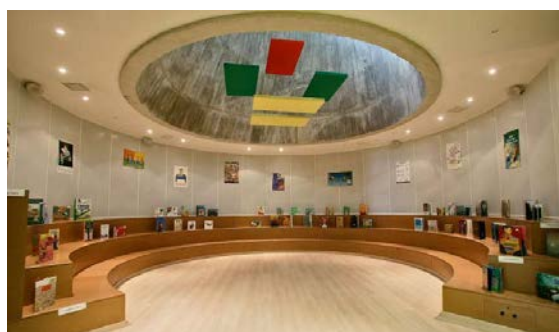
Figure 6 : Salle du conte