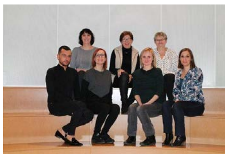
Figure 7 : L'équipe avant le départ d'une collègue

Les effectifs de la médiathèque sont en baisse. Deux départs n'ont pas été remplacés mais des automates de prêt ont été mis en place. Un agent de la filière administrative a pris ses fonctions courant décembre, en mi-temps thérapeutique, dans le cadre d'un reclassement lié à des soucis de santé. Le contrat emploi avenir ne fera pas l'objet d'un renouvellement.