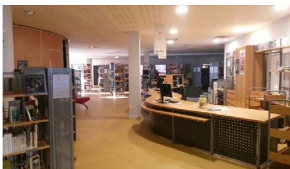
Figure 5 : Banque de prêt. Documentaires adultes