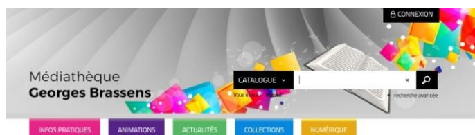
Figure 8 : Portail de la médiathèque

La médiathèque dispose également d'un portail 6 qui permet de consulter le catalogue à distance, de réserver ou prolonger des documents en ligne. Il recense également toutes les infos pratiques, les animations, les actualités et les sélections bibliographiques.