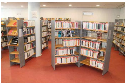
Figure 1 : Espace adulte

Au rez-de-chaussée se trouve l'espace adulte regroupant les livres de fiction (roman, policier, fantastique, théâtre, poésie, textes lus), les bandes dessinées, les revues, la presse et les DVD, une banque de prêt/retour et d'inscription ainsi qu'une grande salle d'exposition.