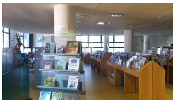
Figure 4 : Espace jeunesse