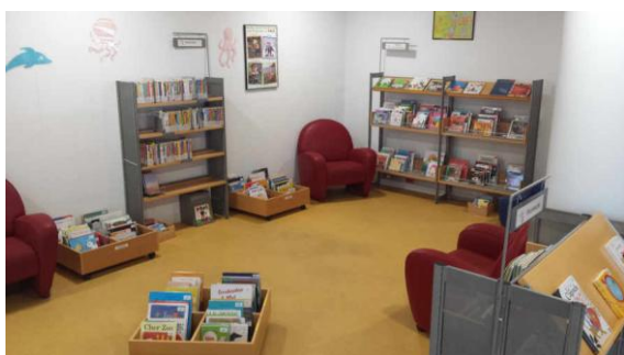
Figure 3 : Marmothèque

Au 1 er étage se trouve l'espace jeunesse composé de la marmothèque (jusqu'à 3 ans), du coin des galopins (jusqu'à 8 ans) et de l'espace jeunes (jusqu'à 13 ans) ainsi que les documentaires adultes et le fonds musique. Des postes informatiques, deux salles de travail (dont une proposant des usuels et le fonds d'histoire locale), une banque de prêt/retour et un espace d'animation (appelé « l'heure du conte ») viennent compléter le tableau.