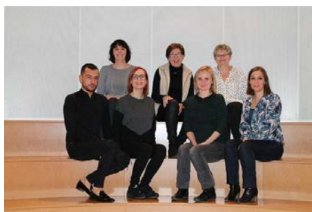
Figure 7 : L'équipe avant le départ d'une collègue

Les effectifs de la médiathèque sont en baisse. Deux départs n'ont pas été remplacés mais des automates de prêt ont été mis en place. Un agent de la filière administrative a pris ses fonctions courant décembre, en mi-temps thérapeutique, dans le cadre d'un reclassement lié à des soucis de santé. Le contrat emploi avenir ne fera pas l'objet d'un renouvellement.