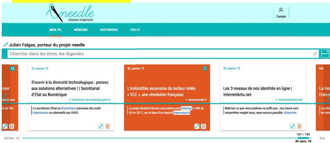
Fig. 2 : l'utilisateur consulte son propre « fil ». Les références pour lesquelles il existe des croisements avec d'autres utilisateurs sont visualisées en orange. Des #mots-dièse permettent une navigation thématique.

co-construit de cette manière décrit un maillage de pages web entremêlées le long des fils de leurs visiteurs au lieu d'être connectées en réseau par des liens hypertextes saisis par leurs concepteurs ou extraites par d'opaques algorithmes.