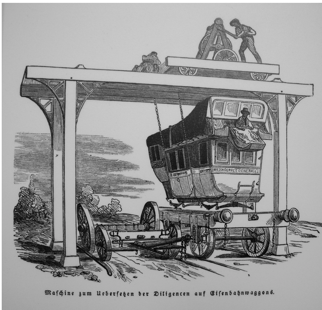
Fig. 1 : Version ancienne d'intermodalité fer-route. Deutsches Museum Verkehrszentrum, Munich, Germany, 19 e siècle.

Il n'y a pas d'innovation sans sources d'inspiration partagées entre auteurs et publics. De l'étude de ces deux cas de récits innovants, découle ainsi une définition de l'innovation en tant que processus de production de sens. Les inventeurs assemblent des cadres de référence de manière originale. Si un public détenteur de ces mêmes cadres se reconnaît dans cet assemblage, alors l'invention est susceptible de s'installer dans les usages et d'accéder au rang d'innovation narrative.