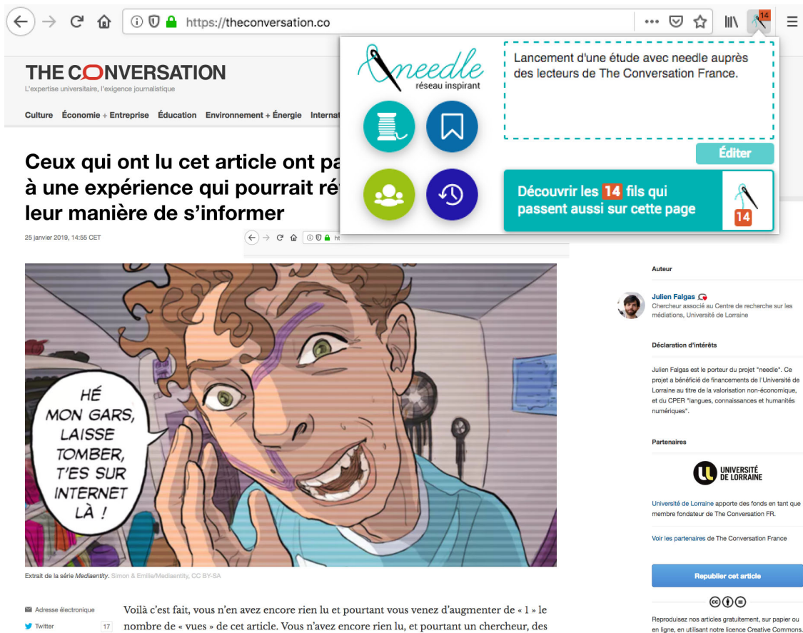
Fig. 3 : d'un clic sur le bouton en forme d'aiguille, l'utilisateur dispose d'un panneau depuis lequel indexer lui-même la page courante le long de son « fil ».