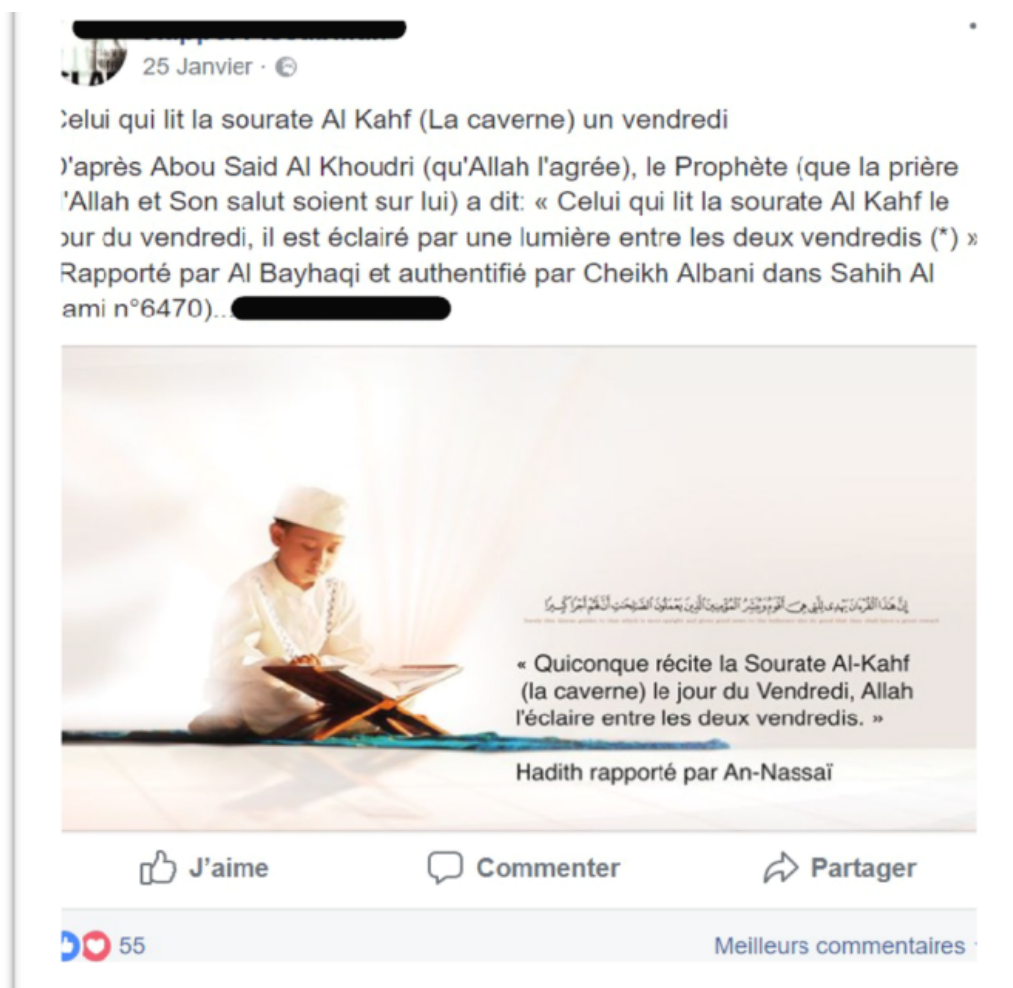
FIGURE 4 – Figure 4 : Extrait de corpus collecté le 25 janvier 2018 sur la page Facebook Rappel Fissabillah.