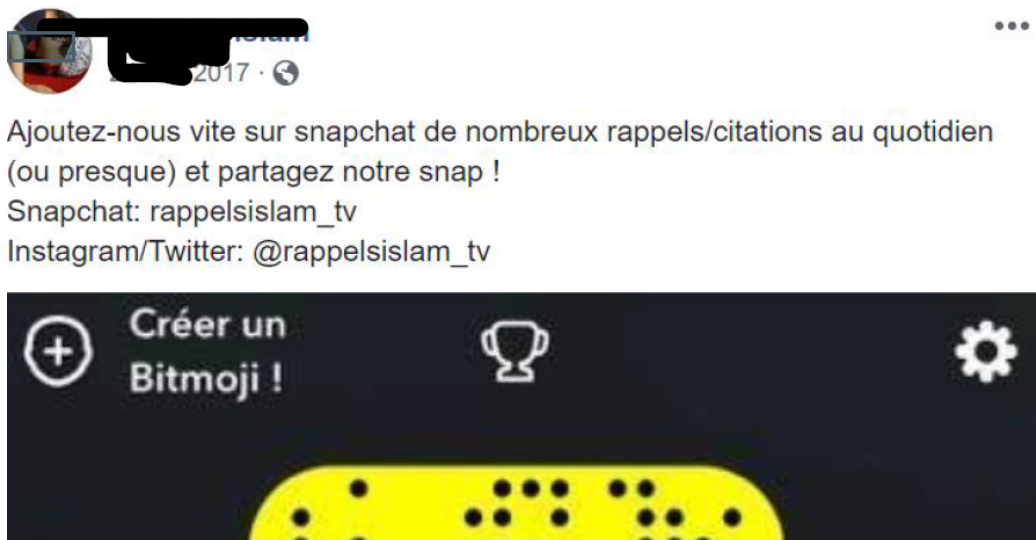
FIGURE 2 – Figure 2 : Extrait de corpus Facebook collecté le 15 décembre 2017 sur la page Rappel Islam .