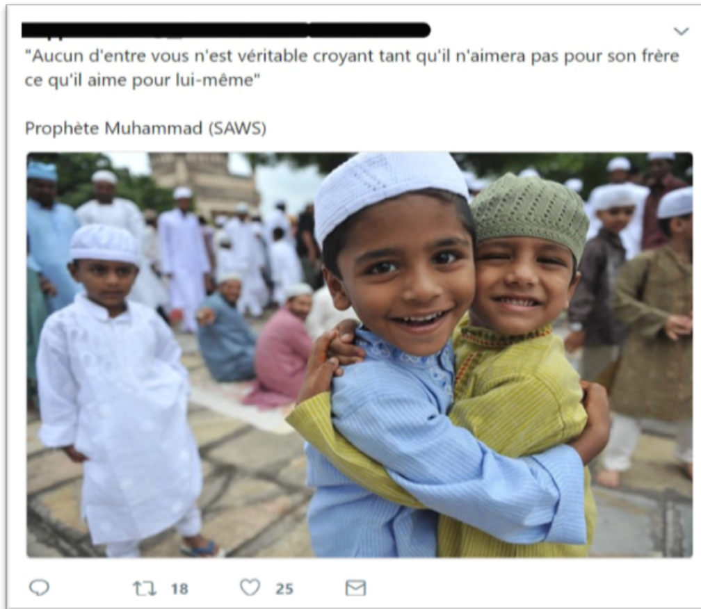
FIGURE 3 – Figure 3 : Extrait de corpus collecté le 20 janvier 2018 sur le compte Twitter d'un utilisateur musulman.

L'utilisateur vient illustrer le hadith par une photographie qui met en scène deux petits garçons qui se prennent dans les bras et qui semblent heureux.