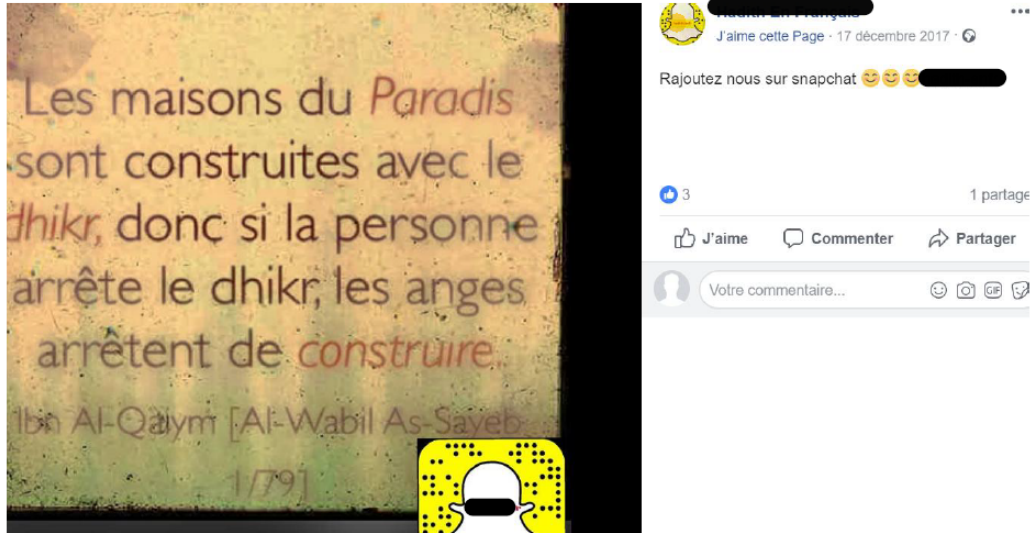
FIGURE 1 – Figure 1 : Extrait de corpus Facebook collecté le 23 décembre 2017 sur la page Hadith en Français .