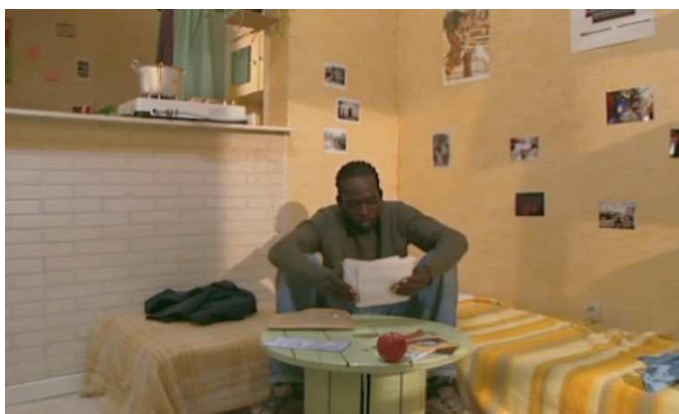
Vers la fin du film : Sogui lisant la lettre de Samba (1:10')

C'est avec le même look qu'on retrouvera Sogui vers la fin du film où on le voit avec les mêmes tresses en train de lire la lettre de Samba, avec la même voix off de celui-ci.