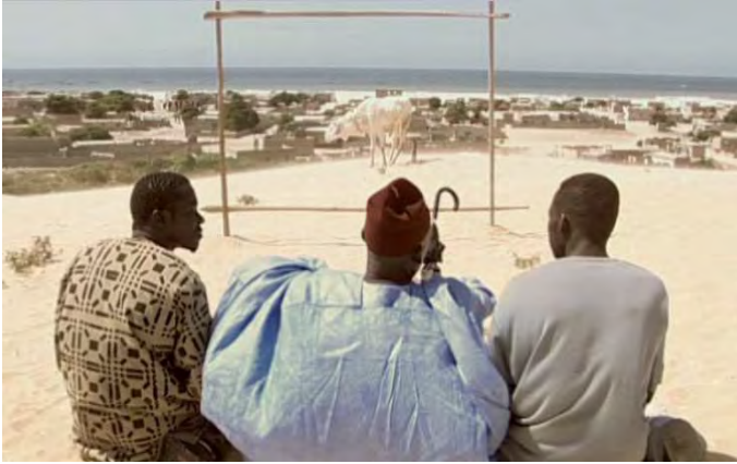
Le vieux du village entre Sogui et Samba, en face du cadre (1:08')

Ce cadre à l'arrière-plan océanique vers lequel sont tournées le regard des personnages comme celui du spectateur, symbolise la pensée du jeune Sogui, un cadre dont il doit sortir à l'image du béliet qui l'occupe, et qui pourrait tout aussi bien symboliser le combat, pour s'ouvrir à l'extérieur, voyager, découvrir de nouveaux horizons, s'enrichir à travers la découverte d'autres peuples et d'autres cultures.