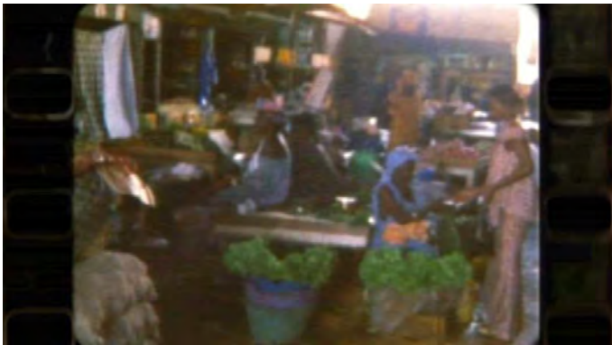
Le marché filmé par Samba (22')

Déjà à titre de pré-générique, le film s'ouvre sur quelques images du 'film dans le film'. Le marché est présenté ici de façon sommaire. C'est après que viennent sur un fond noir les indications génériques accompagnées d'un bruitage du marché avec des voix, audibles certes, mais à peine identifiables, des personnages secondaires et anonymes ayant une simple fonction de remplissage. Dès les premières minutes du film, le spectateur pénètre dans un univers agité, perceptible tant sur le plan visuel qu'auditif. Le marché revient plus tard intégré, cette fois dans le film, sur une longue séquence illustrée (23') qui fait voir différents personnages de différentes couches sociales.