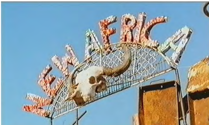
Still from Complot d'Aristote, (1996, directed by Jean-Pierre Bekolo,), depicting an ox's skull at the entrance of the cinema "New Africa", referencing Mambety's Touki Bouki

Does Bekolo adhere to the historical development of criticism, which distanced itself from neo-Marxist discourses that informed theories of Third World Cinema and which oppose to the didactic tradition and social critique of Ousmane Sembène? We will try to nuance this common discourse 28 in which Bekolo carries out la mort du père in regard to Ousmane Sembène and in which Bekolo is situated in the same vein as Djibril Diop Mambety, by showing how the parallel Sembène/Bekolo is not so incongruous despite their extreme positioning at the far ends of one another in the field of African cinema and by showing some of the discrepancies in the kinship of Bekolo with Djibril Diop Mambety. Bekolo takes an ambivalent position with regard to social criticism and political dissent, which characterizes the committed cinema of Sembène Ousmane. On the one hand, Bekolo believes that this kind of cinema basically recycles the idea of a chaotic, unstable, desperate and dependent Africa. "In these films," he says, "Africa is stuffed with tragedies or always tends toward the negative." 29 Sembène "was an Aristotelian disciple", says Bekolo, "who was from a generation that wanted to speak French better than the French. In some ways, he was quite conservative and content to be, though he was politicised in his views. His voice was actually rather absent from his films. He was a model African filmmaker, but you have to wonder