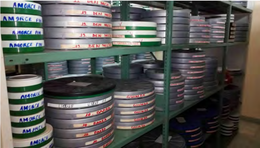
Les collections de la Cinémathèque africaine comptent plus de 160 copies de films 16 mm et 35 mm.

La cinémathèque dispose de quatre salles de stockage, trois bureaux, un magasin, et une salle de projection pour mener à bien sa politique de conservation. Si elle ne détient pas les droits des films et ne bénéficie pas du système de dépôt légal, la cinémathèque enrichit toutefois ses collections d'années en années grâce aux dépôts volontaires de films, effectués par des ayants-droit.