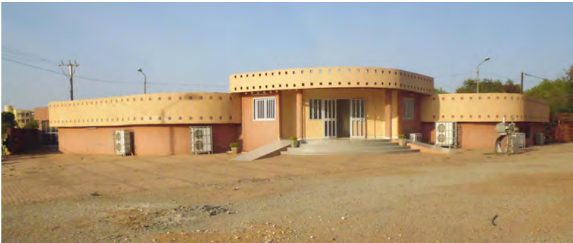
La Cinémathèque de Ouagadougou, principale institution cinématographique africaine vouée à la mémoire animée du continent.

D'emblée, il faut le dire : la Cinémathèque Africaine de Ouagadougou est nécessaire. Dès sa création en 1989 à l'initiative des cinéastes africains, elle se fixe comme objectif de promouvoir la culture cinématographique africaine, de créer des archives de cinéma, d'acquérir, conserver et valoriser les différentes images tournées sur le continent dans un but à la fois historique et pédagogique.