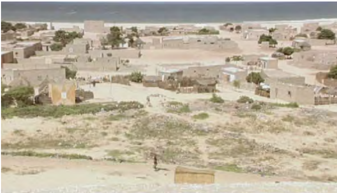
Plongée sur la dune (au village) (1:07')

L'oncle de Samba entraîne ce dernier et son ami vers une dune. Un prétexte pour le réalisateur pour présenter le village et son caractère désuet caractérisé par le manque d'infrastructures: