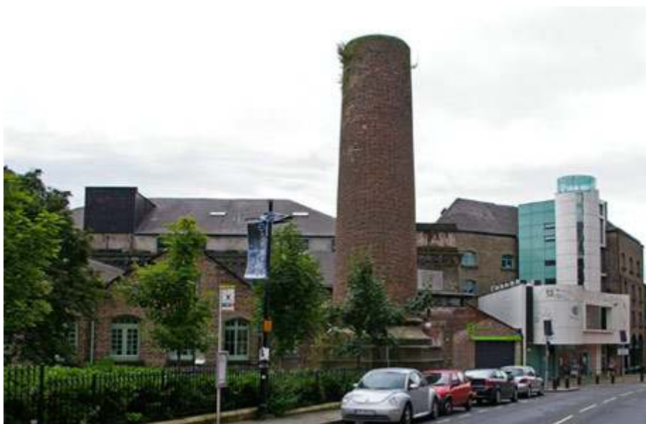
Photo 5 : Seven Stories : un exemple de reconversion culturelle du patrimoine industriel de la vallée de l'Ouseburn

Seven Stories est un pôle culturel consacré au livre pour enfants, installé dans un ancien entrepôt victorien de la vallée de l'Ouseburn. Ouvert en 2005, Seven Stories est devenu le symbole de la reconversion du patrimoine industriel dans cette vallée où la culture est devenue le nouveau moteur économique.