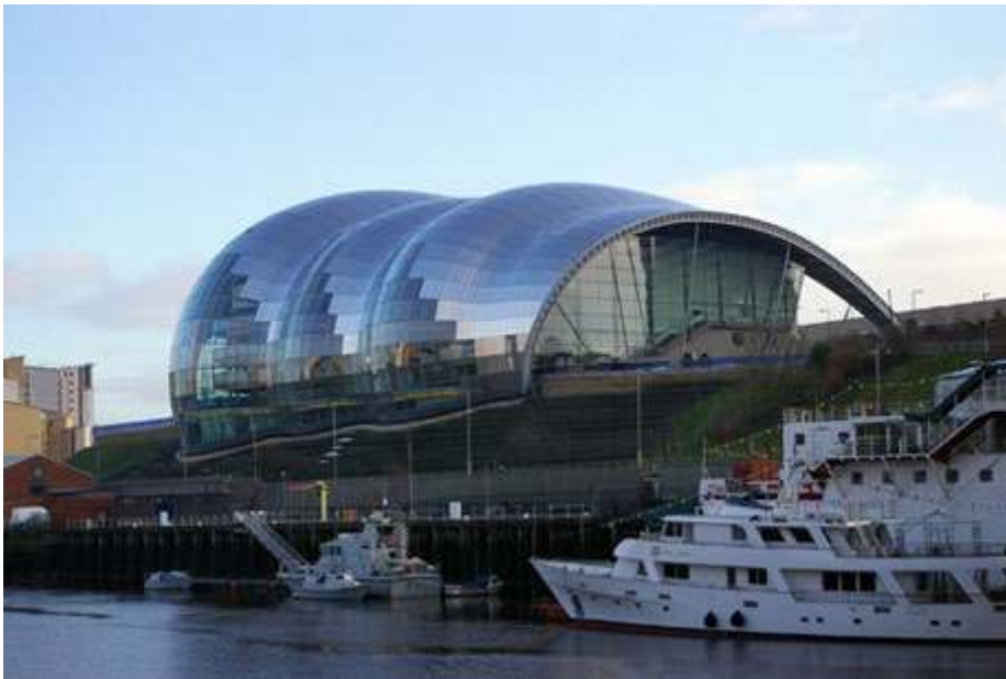
Photo 3 : Le Sage de Gateshead, symbole du renouveau culturel

Le Sage Gateshead est le nouveau centre de la scène musicale du Nord de l'Angleterre. Il abrite la plus grande salle de musique classique du pays en dehors de Londres. Il accueille également des congrès et des conférences. Son architecture, dessinée par Norman Foster, lui a valu de nombreux détracteurs et le surnom de slug (limace).