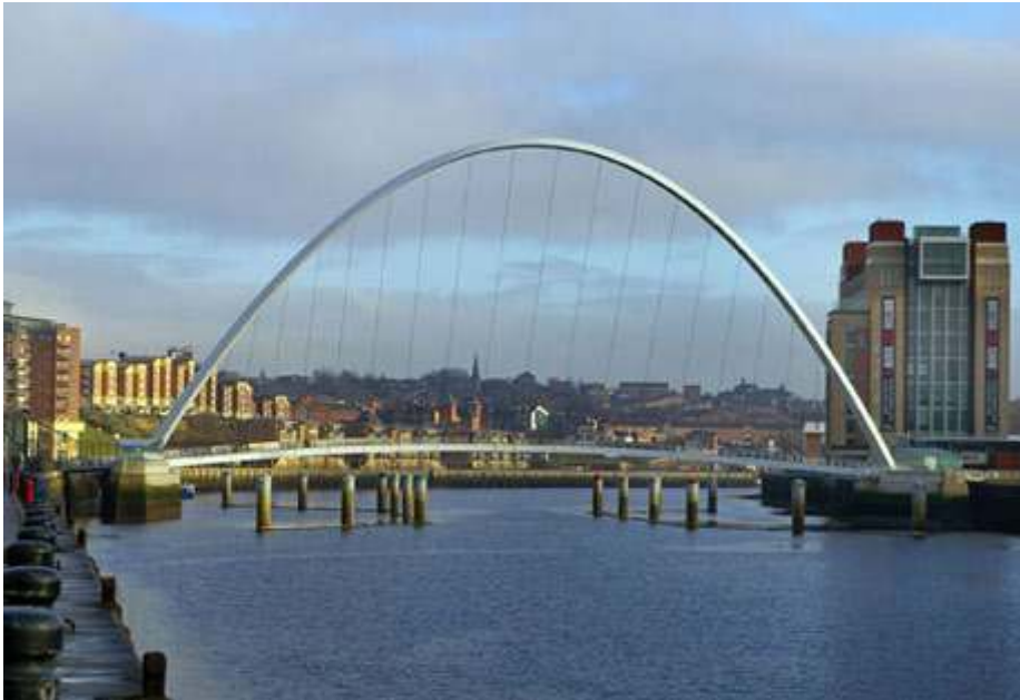
Photo 2 : Le Millennium Bridge et le Baltic Museum : la perspective du nouveau Newcastle (M.Bailoni, 2006)

Le Baltic Museum (à droite) est aménagé dans une ancienne minoterie réhabilitée. Le Millennium Bridge passerelle ultramoderne fait le lien entre les deux rives de la Tyne, entre Newcastle (à gauche) et Gateshead (à droite), au cœur du nouveau quartier culturel très animé le soir. A l'arrière plan, d'anciens espaces industriels et commerciaux ont été reconvertis pour des logements de standing, et de nouveaux quartiers ont été construits sur les friches industrielles le long de la rivière, nouvel axe de prestige au cœur de l'agglomération.