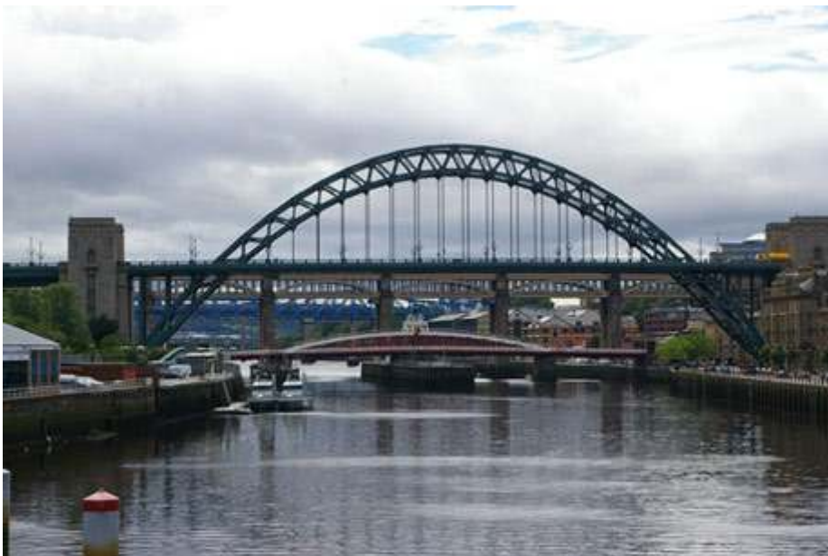
Photo 4 : Les ponts au dessus de la Tyne : la perspective traditionnelle de Newcastle, symbole du triomphe industriel

La perspective des sept ponts (dont le Millenium Bridge) est l'image la plus célèbre de Newcastle. Sur cette photo on en distingue cinq, du premier à l'arrière plan : le Tyne Bridge (en vert, 1928), le Swing Bridge (en rouge et blanc, 1876), le High Level Bridge (1849) – pont à double niveau, dessiné par Robert Stephenson – le Queen Elizabeth II Bridge (en bleu, 1981) et le King Edward VII Bridge (1906).