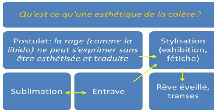
Schéma 2 : Entrave et circuits esthétisés de la colère

Theodor Adorno ou Frantz Fanon avaient déjà perçu un lien critique entre l'expérience de la domination ou de l'aliénation et la recherche de la transe (Fanon, 1961, pp. 87-88 ; Adorno, 1950, 1971, 2001). Comme l'aliénation, la colère pourrait donc aussi être sublimée, exhibée et procurer un apaisement à son créateur et ses spectateurs. Elle serait accolée à un « rêve de remplacement » et à une forme subtile, socialement diffusable et acceptable de névrose esthétisée. Cette dernière correspondrait à un état de prépossession. La forme esthétique condense alors les émotions et les rages. Elle contient des parcelles de l'énergie négative ou positive antécédente tout en exprimant une idéalisation de soi, en réaction à une révolte non aboutie et à une domination frustrante. Le sublime console donc l'individu créateur ou spectateur en l'arrimant fermement à une forme identitaire (commune) possible, et donc à un fétiche idéalisé.