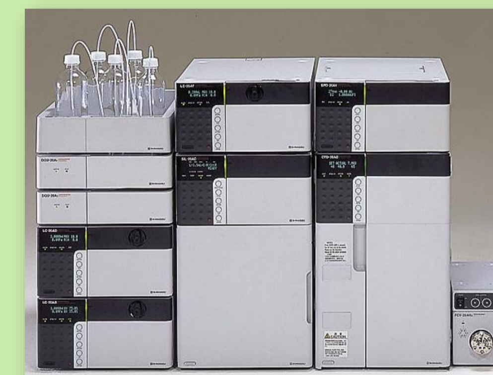
HPLC (Chromatographie en phase liquide à haute performance)