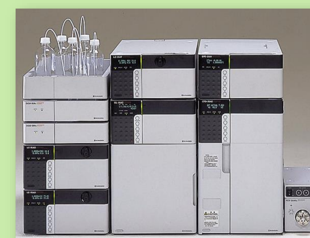
HPLC (Chromatographie en phase liquide à haute performance)