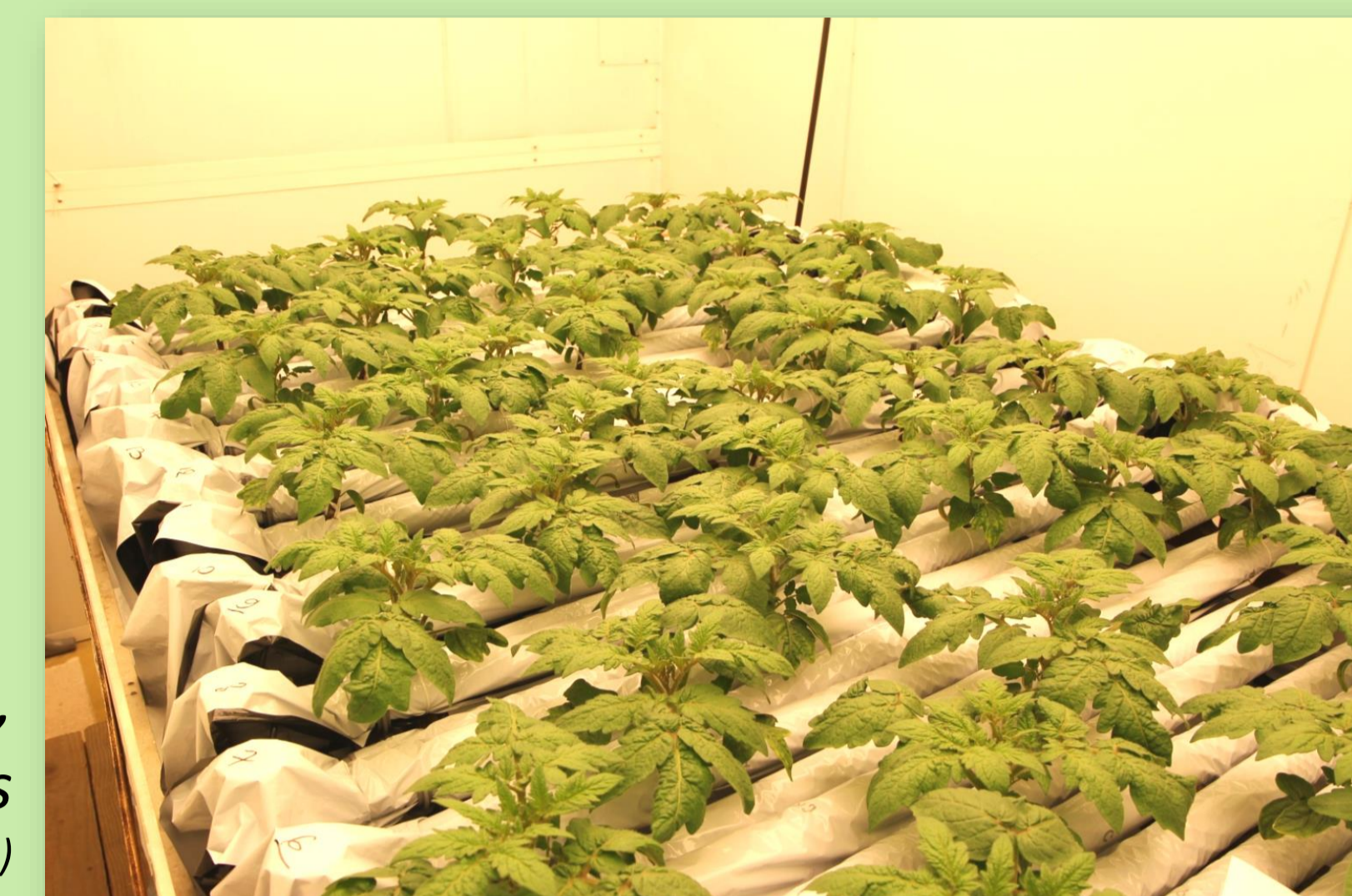
Tomates cultivées en hydroponie, en conditions contrôlées (expérimentation Avignon 2014)