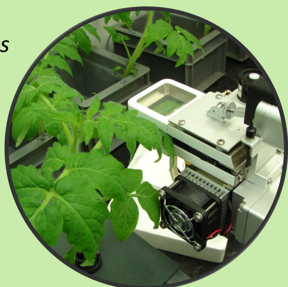
Appareil de mesure des échanges gazeux