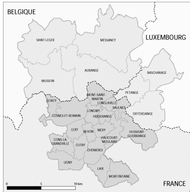
Fig. 1 : Le pôle Européen de Développement

L'aire transfrontalière regroupe 127.000 habitants. Il s'agit d'une des plus importantes concentrations urbaines de la Grande Région. Le territoire est polarisé par quatre petites villes situées dans la Vallée de la Chiers: Athus (Commune d'Aubange) en Belgique - Longwy en France - Differdange et Pétange au Luxembourg.