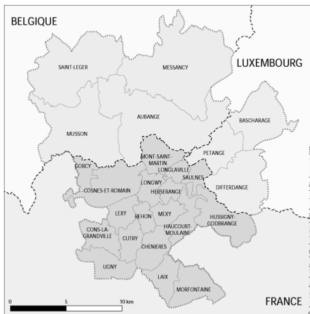
Fig. 1 : Le pôle Européen de Développement

L'aire transfrontalière regroupe 127.000 habitants. Il s'agit d'une des plus importantes concentrations urbaines de la Grande Région. Le territoire est polarisé par quatre petites villes situées dans la Vallée de la Chiers: Athus (Commune d'Aubange) en Belgique - Longwy en France - Differdange et Pétange au Luxembourg. Avant la mise en place d'une politique d'aménagement territorial d'inspiration communautaire dans les années 1980, le point frontière au croisement de la Région Terres Rouges luxembourgeoise, de la Province de Luxembourg belge et du bassin de Longwy en Lorraine n'était pas un no man's land. L'industrie minière et sidérurgique a façonné un espace non cloisonné par les frontières étatiques depuis plus d'un siècle. Une dynamique rattachée aux première et seconde révolutions industrielles est perceptible sur les trois versants de l'espace transfrontalier. L'expansion économique a conduit à une continuité