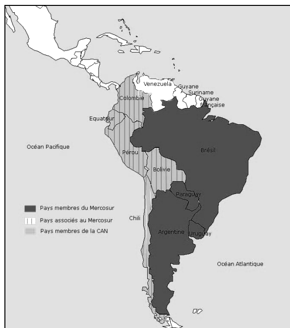
Fig. 1 : L'intégration en Amérique du Sud en 2006

La structuration récente d'une initiative pour l'« Intégration de l'Infrastructure Régionale Sud-Américaine » (IIRSA, http://www.iirsa.org/ et cf. Zibechi, R., 2006) témoigne du degré d'implication des banques dans l'intégration continentale et les négociations frontalières. L'IIRSA est née du premier sommet sud-américain des présidents (2000) -dont il n'est pas anodin de noter qu'il se tenait au Brésil-, devant mener en 2004 à la signature de la Communauté Sud-Américaine des Nations (CSAN), accord de rapprochement entre CAN et Mercosur dont elle apparaît comme la réalisation la plus tangible à ce jour. Il s'agit d'un programme de coordination de construction de routes, voies fluviales, réseau énergétique et de communications à l'échelle du continent, dont l'objectif est de structurer des axes