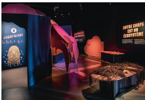
Figure 1. Exposition Mini-monstres, les invisibles (26 juin 2019 - 13 mars 2020).