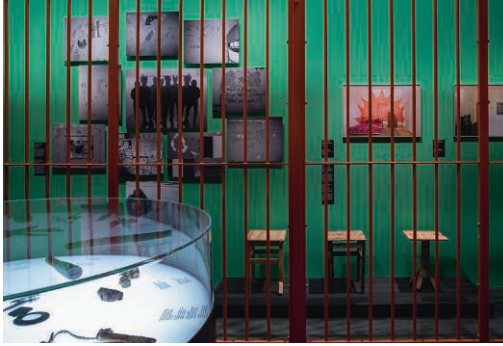
Figure 3. Prison, au-delà des murs (18 octobre 2019 - 26 juillet 2020).

inutiles. Le Musée de la Croix-Rouge de Genève a eu une autre manière de penser les choses. Ils ont laissé les images, mais il se trouve aussi que ce musée n'a pas le même public que nous. Je me rappelle d'une scène que je trouvais totalement inutile, c'est une scène de viol sous les douches dans une prison américaine pour hommes. En fait, le montage que nous avons proposé s'arrête à un moment donné, au moment où l'on va comprendre ce qui se passe par la suite. Pour le comprendre, on n'avait pas besoin de le montrer. Donc je ne vois pas à quoi ça sert finalement de le laisser. Vous shuntez l'extrait avant et c'est pareil : vous avez compris ce qu'il va se passer, le jeu des regards, et c'est à mon sens suffisant. Et j'irai même plus loin : ça porte plus, ça atteint mieux sa cible que si vous montrez les images. Vous montrez les images, vous allez avoir quatre fois sur cinq du rejet. Vous n'allez pas regarder la suite, vous sortez de la salle et vous ratez votre cible. Hors contexte des musées, et là c'est un discours qui n'engage que moi, je trouve que la suggestion, quand elle est compréhensible, est beaucoup plus forte que l'image directe. Puisque si vous comprenez ce qu'il va se passer, pour moi l'émotion est là, en tout cas l'émotion que nous recherchons.