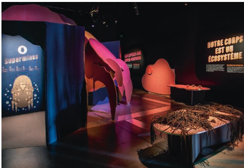
Figure 1. Exposition Mini-monstres, les invisibles (26 juin 2019 - 13 mars 2020).