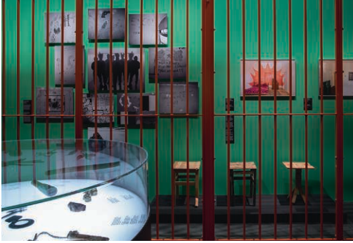
Figure 3. Prison, au-delà des murs (18 octobre 2019 - 26 juillet 2020).

inutiles. Le Musée de la Croix-Rouge de Genève a eu une autre manière de penser les choses. Ils ont laissé les images, mais il se trouve aussi que ce musée n'a pas le même public que nous. Je me rappelle d'une scène que je trouvais totalement inutile, c'est une scène de viol sous les douches dans une prison américaine pour hommes. En fait, le montage que nous avons proposé s'arrête à un moment donné, au moment où l'on va comprendre ce qui se passe par la suite. Pour le comprendre, on n'avait pas besoin de le montrer. Donc je ne vois pas à quoi ça sert finalement de le laisser. Vous shuntez l'extrait avant et c'est pareil : vous avez compris ce qu'il va se passer, le jeu des regards, et c'est à mon sens suffisant. Et j'irai même plus loin : ça porte plus, ça atteint mieux sa cible que si vous montrez les images. Vous montrez les images, vous allez avoir quatre fois sur cinq du rejet. Vous n'allez pas regarder la suite, vous sortez de la salle et vous ratez votre cible. Hors contexte des musées, et là c'est un discours qui n'engage que moi, je trouve que la suggestion, quand elle est compréhensible, est beaucoup plus forte que l'image directe. Puisque si vous comprenez ce qu'il va se passer, pour moi l'émotion est là, en tout cas l'émotion que nous recherchons.