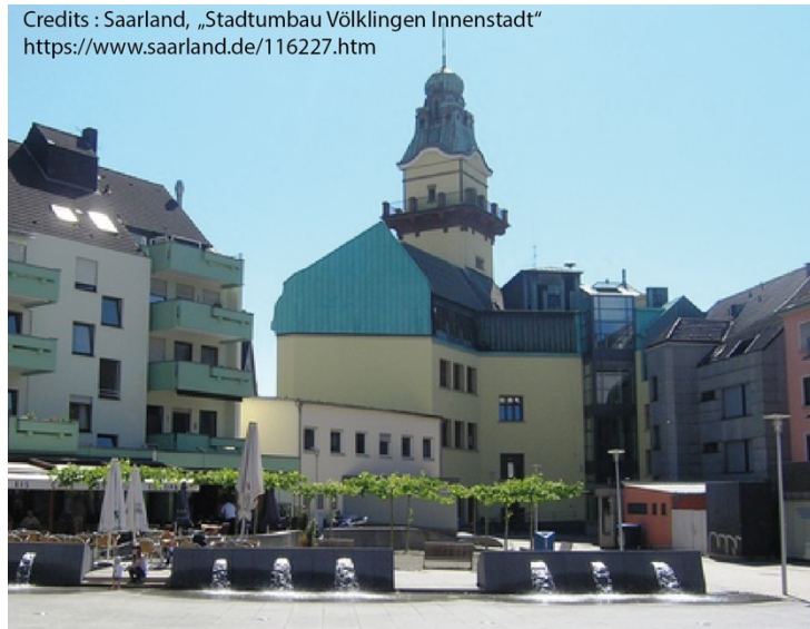
Illustration 4. Principaux résultats du programme de rénovation urbaine Stadtumbau-West pour la ville de Völklingen.

le milieu des années 2000, Völklingen ne comptait aucun parc. Le programme Stadtumbau a comblé ce manque avec la place Adolph-Kolping, situé entre l'ancienne mairie et l'Eligiuskirche.