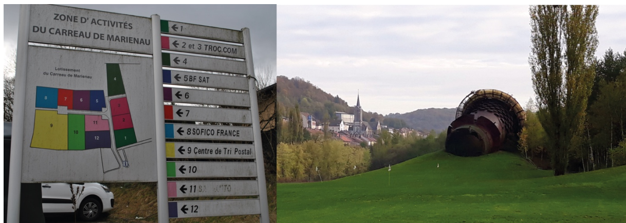
Illustration 2. Les toponymes et autres éléments du paysage comme maigres témoins du passé industriel lorrain

Légende : Zone d'activités du carreau de Marienau (Forbach, Moselle, France, 19/01/2018) et « Le Haut Fourneau couché » (Longwy, Meurthe-et-Moselle, France, 24/10/2019)