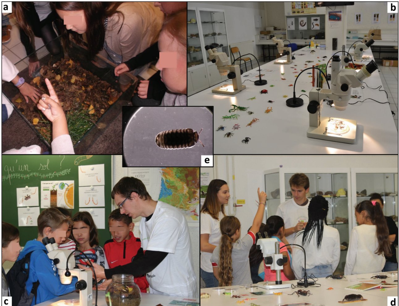
Figure 4 - Theme 3: What is hidden under our feet? a: handling activity in the terrarium; b: binocular magnifier; c and d: activity guiding by students; e: binocular observation of a diplopod.