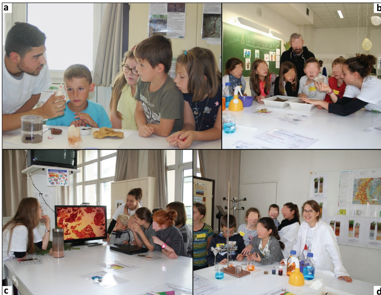
Figure 3 - Theme 2: What are soil ingredients? a: HCl test; b: soil texture estimation by feel; c: soil organization observation through a soil column and a thin section (screen); d: soil percolation with methylene-blue and eosin.

Figure 3 - Thème 2 : Quels sont les ingrédients du sol ? a : test HCl ; b : estimation de la texture du sol au toucher ; c : observation d'une colonne de sol et d'une lame mince de sol (écran) ; d : percolation au bleu de méthylène et à l'éosine.