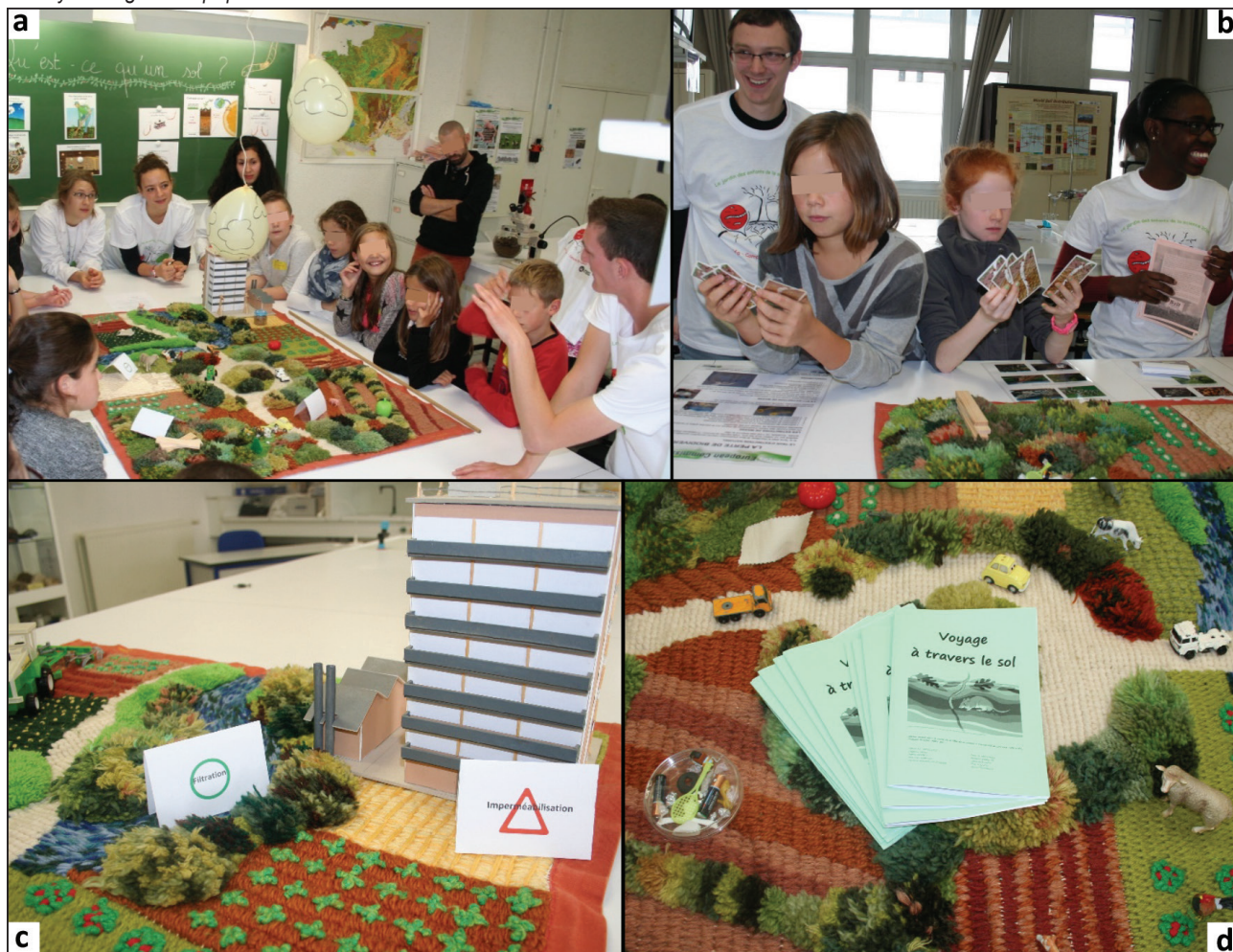
Figure 5 - Theme 4: soil obliges us through providing services... what about us? a: discussion about soil services and risks; b: pupils handling the 7 families game "the hidden life of soils"; c: tags indicating a service (green circle) or a risk (red triangle); d: coloring and activity book given to pupils.

Figure 5 - Thème 4 : Le sol nous rend service... et nous en échange ? a : débat sur les services et menaces autour du tapis ; b : élèves découvrant le jeu des 7 familles « La vie cachée des sols » ; c : étiquettes précisant les services écosystémiques rendus par les sols (rond vert) et les menaces pesant sur les sols (triangle rouge) ; d : livret distribué aux élèves en fin d'atelier.