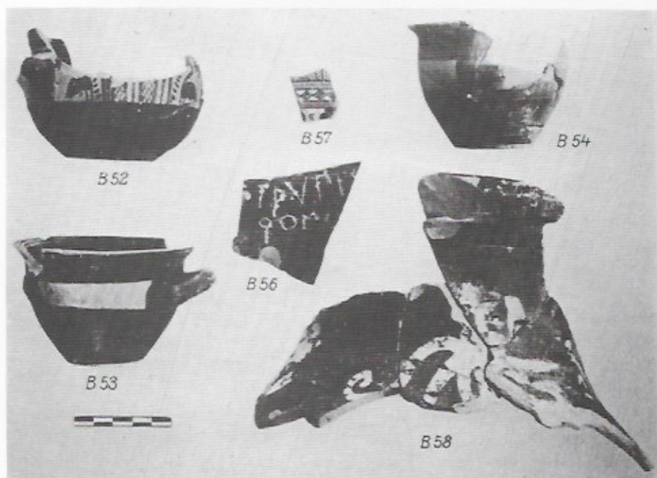
FIG. 2. — Matériel associé à P 4663 (d'après R. S. Young, 1939, fig. 88, p. 123).