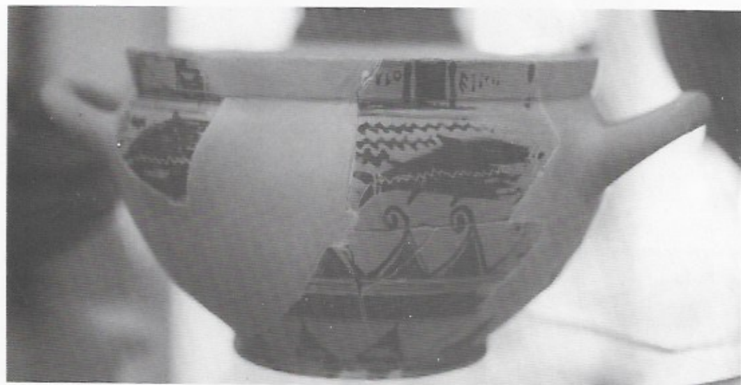
FIG. 3. — Agora P 7014.