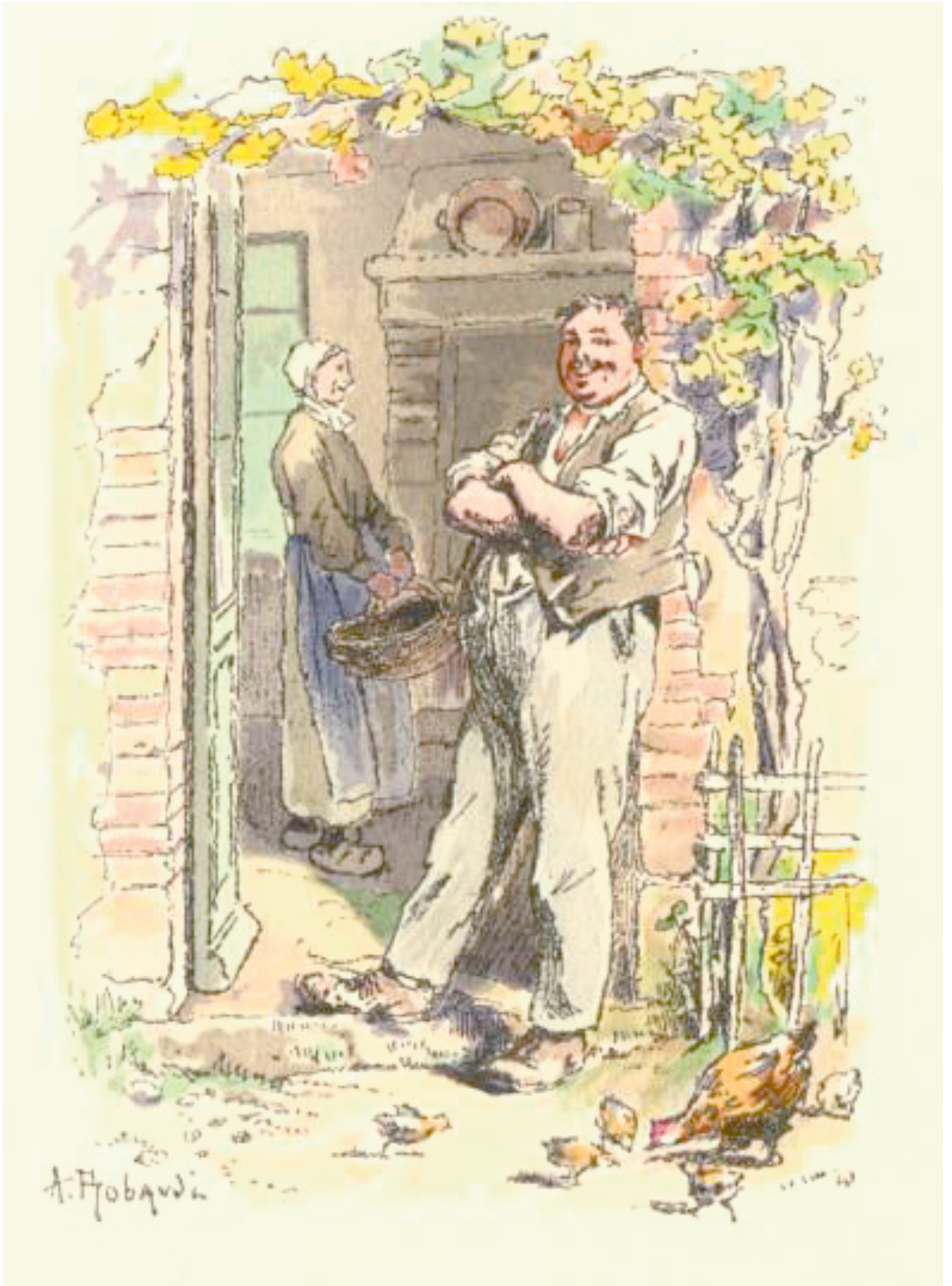
Illustration 3 :1923. Toine suivi de Histoire d'une fille de ferme , Illustrations en couleurs par A. Robaudi, Paris, A. Ferroud & F. Ferroud, 1923