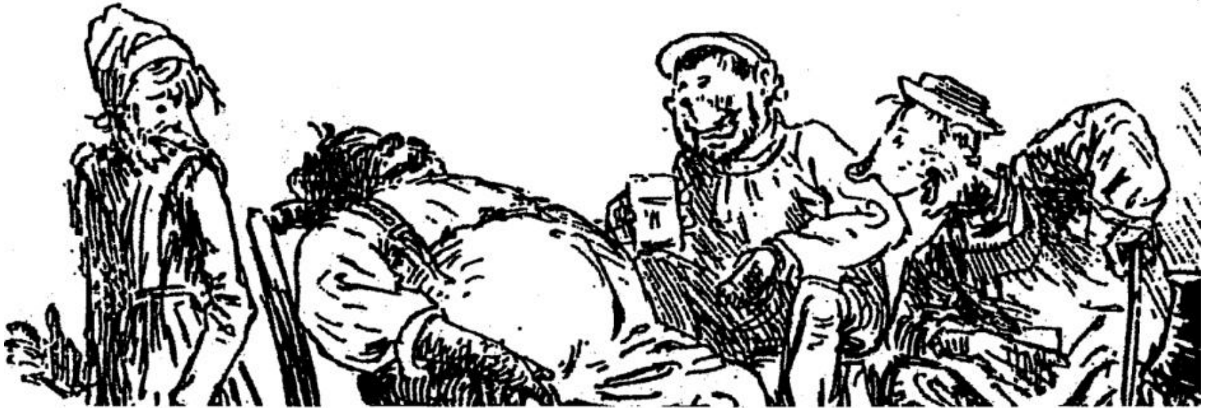
Illustration 1 : 1886. Toine , Edition originale, Illustration P.-E. Mesplès, Paris, Bibliothèque illustrée à 5 francs le volume, Marpon & Flammarion, 1886. (Détail agrandi par nos soins)