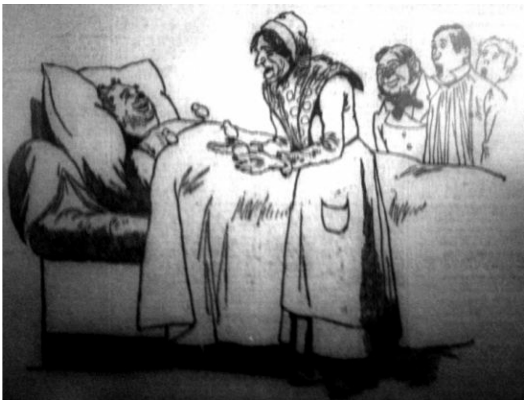
Illustration 6 : 1888. La Lanterne . Supplément littéraire, 5 août 1888, avec un dessin anonyme.