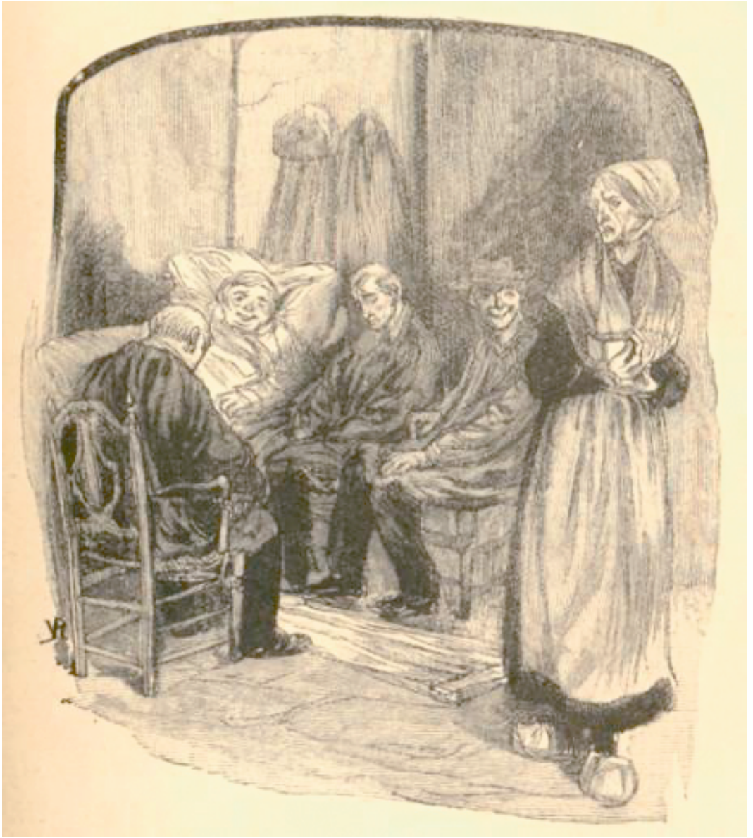
Illustration 2 : 1903. Toine , Illustration V. Rottembourg, gravée sur bois par G. Lemoine, Paris, Ollendorff, Œuvres complètes illustrées de Guy de Maupassant, 1903.