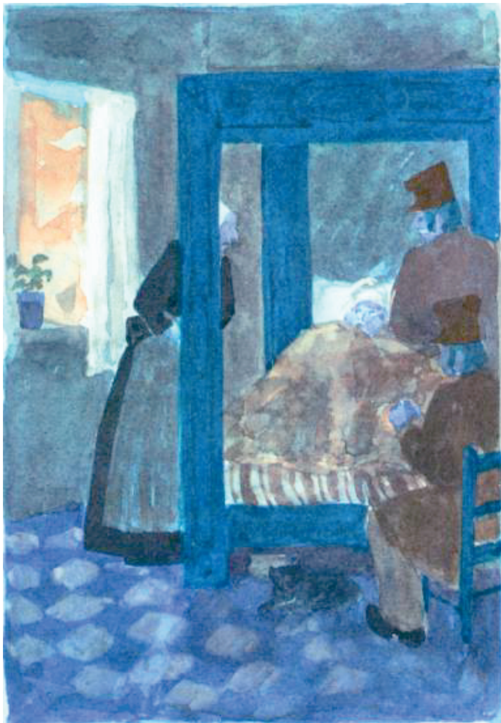
Illustration 5 :1970. Toine , Illustrations de Jean-François Debord, Paris, L'Édition d'Art H. Piazza, 1970.