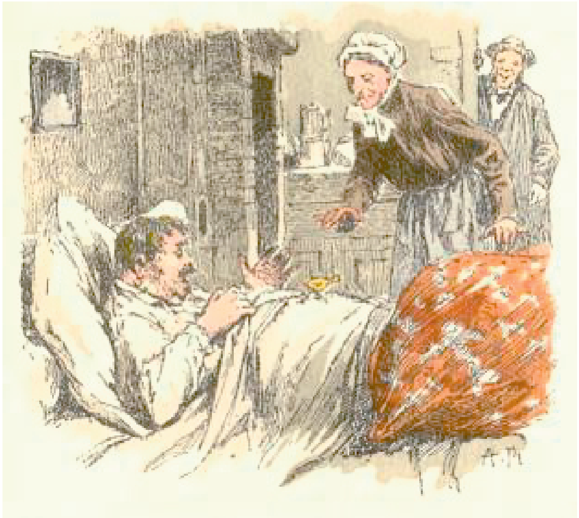
Illustration 3 :1923. Toine suivi de Histoire d'une fille de ferme , Illustrations en couleurs par A. Robaudi, Paris, A. Ferroud & F. Ferroud, 1923