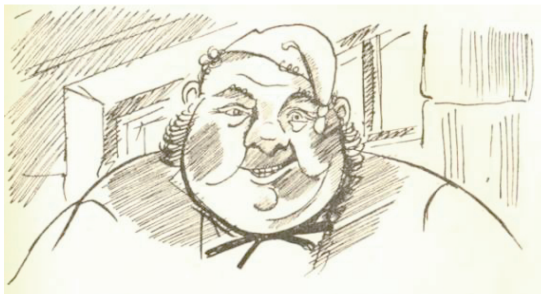
Illustration 4 : 1938. Toine , Illustrations P. Falké, Paris, Librairie de France, Œuvres complètes illustrées de Guy de Maupassant, V, 1938.