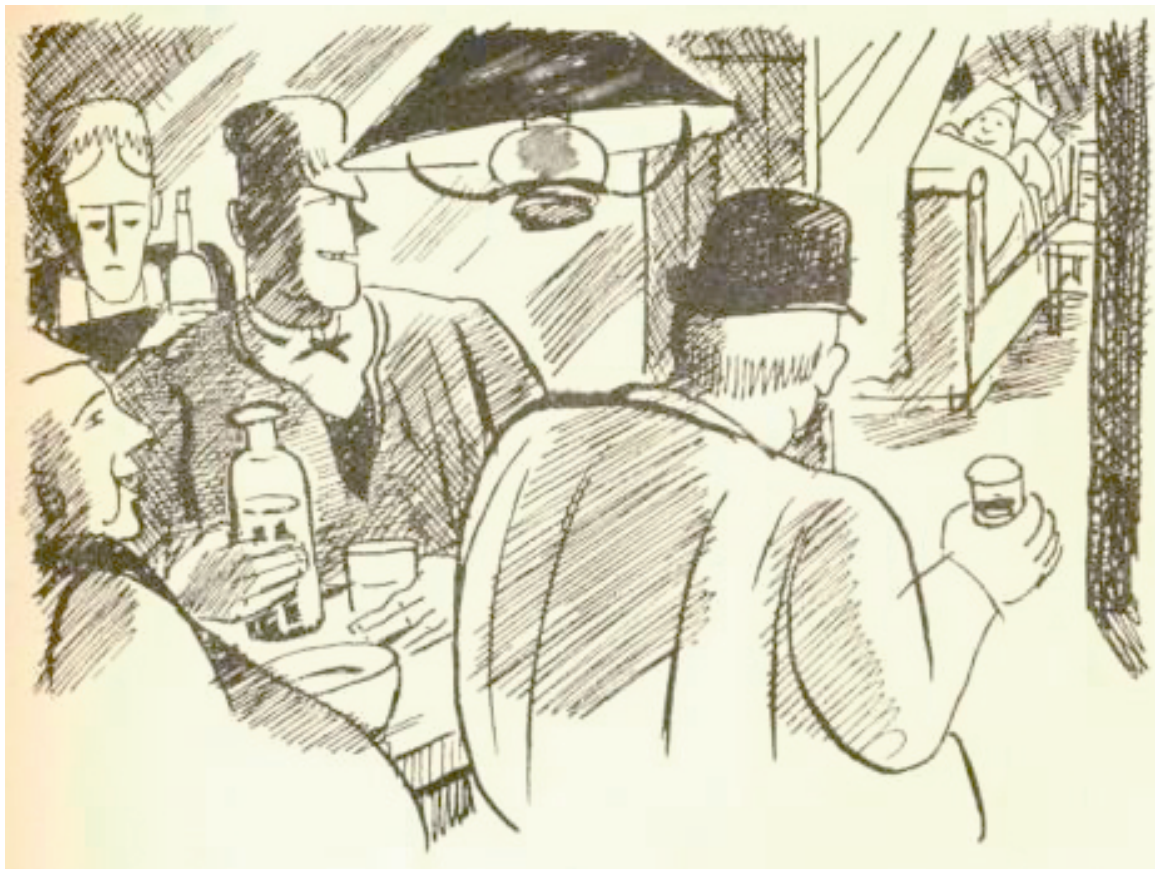
Illustration 4 : 1938. Toine , Illustrations P. Falké, Paris, Librairie de France, Œuvres complètes illustrées de Guy de Maupassant, V, 1938.