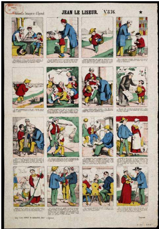
Illustration 2 : « Jean le Liseur », image d'Épinal, 1869