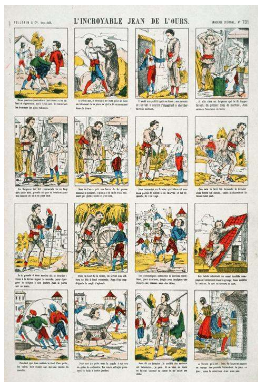
Illustration 1 « L'Incroyable Jean de l'Ours », Épinal, Pellerin & Cie, 1875