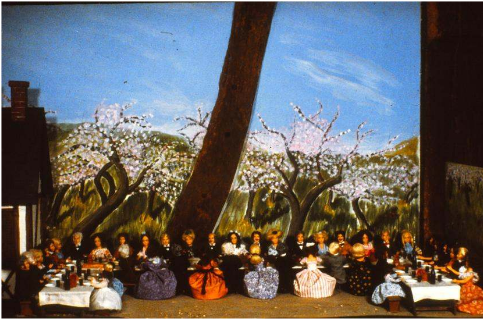
La noce aux Bertaux, Galerie Bovary. Musée d'automates. En ligne < http://musee-bovary.net/scenesanimeesduroman.html > (consulté le 5 janvier 2020).