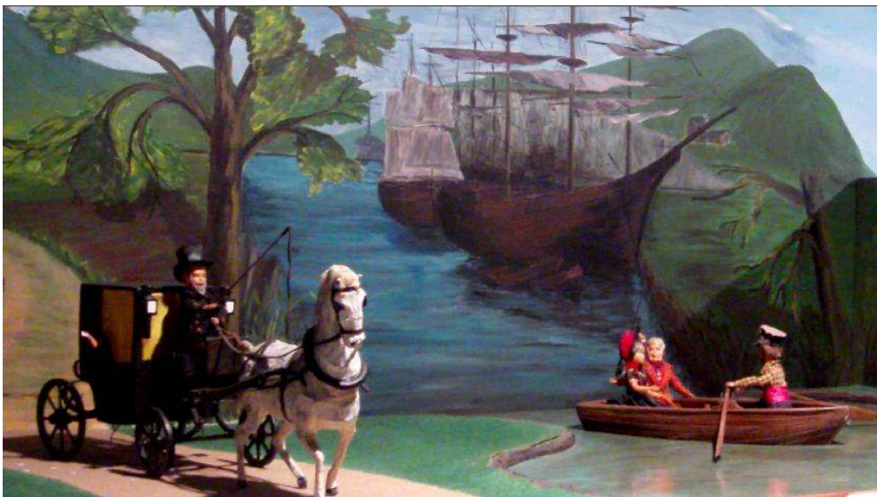
Les amants à Roue, Galerie Bovary. Musée d'automates. En ligne < http://musee-bovary.net/scenesanimeesduroman.html > (consulté le 5 janvier 2020).