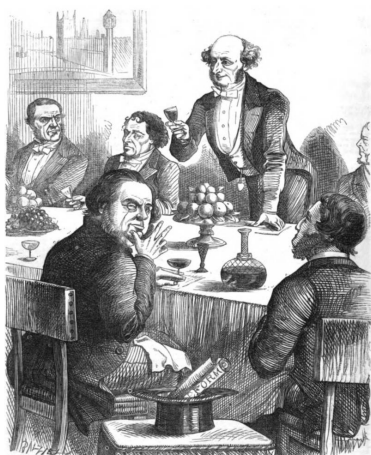
Disraeli, Gladstone et John Bull lui-même regardent avec suspicion le philosophe libéral John Stuart Mill, dans ce dessin paru dans Fun magazine. Mais les poètes avaient un autre point de vue.

de ces poètes renommés s'ajoutent un certain nombre de poèmes anonymes. L'ensemble des poèmes étudiés permet d'esquisser comment, concrètement, s'élabore une nouvelle conception libérale de la vie universitaire.