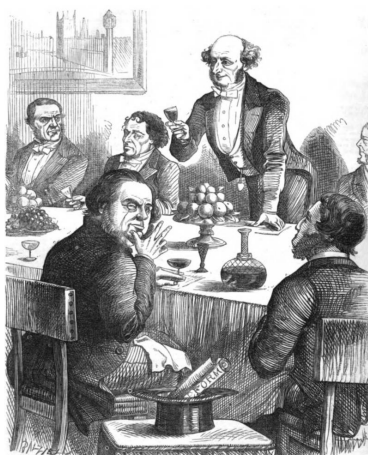
Disraeli, Gladstone et John Bull lui-même regardent avec suspicion le philosophe libéral John Stuart Mill, dans ce dessin paru dans Fun magazine. Mais les poètes avaient un autre point de vue.

de ces poètes renommés s'ajoutent un certain nombre de poèmes anonymes. L'ensemble des poèmes étudiés permet d'esquisser comment, concrètement, s'élabore une nouvelle conception libérale de la vie universitaire.