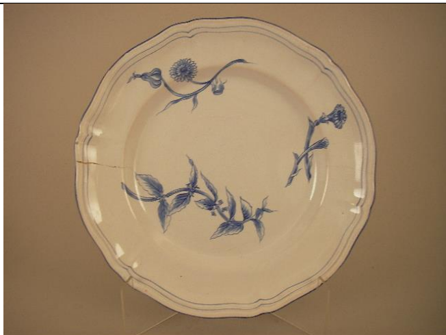
Inv. JB82.12, service Herhier.

L'entrée d'Émile Gallé aux côtés de son père s'illustre à travers les objets suivants, en redéfinissant le fondement des motifs ( Annexes 41 et 42 ) :