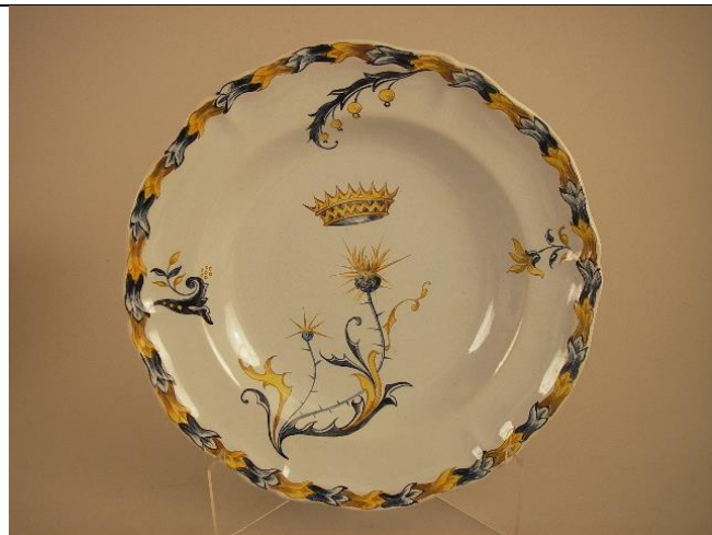
Inv. JB82.10, service Héraldique.

Enfin, les œuvres d'Émile Gallé tranchent complètement avec les anciens moules privilégiés par son père. Sans oublier le contexte des Expositions (qui aident l'affaire Gallé à faire son chiffre d'affaire, par le renouvellement des commandes, surtout autour des « objets de luxe ») qui demandent de redoubler d'efforts pour surprendre le public d'amateurs et de connaisseurs, les œuvres réalisées n'ont plus rien à voir avec des assiettes blanches structurées par un marli ajouré. Les influences se croisent pour sublimer le symbolisme d'Émile Gallé, et rendre hommage à la matière de confection (la faïence), à la forme dont l'usage est bouleversé, aux motifs ornementaux ( Annexes 43 et 44 ).