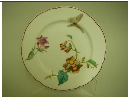
Inv. 992.9.3. Assiette en porcelaine au décor par décalcomanie.