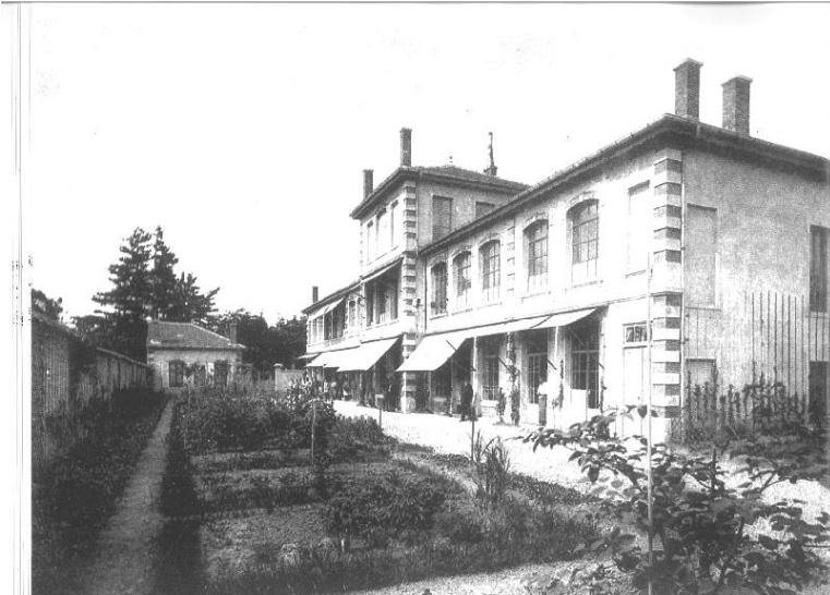
Photographie anonyme de 1886, musée lorrain, Nancy. Extrait de L'usine d'art Gallé à Nancy , LE TACON François et DE LUCA Flavien.

(Plan extrait de l'ouvrage de MM. DE LUCA et LE TACON.) La numérotation détaille l'agencement des espaces.