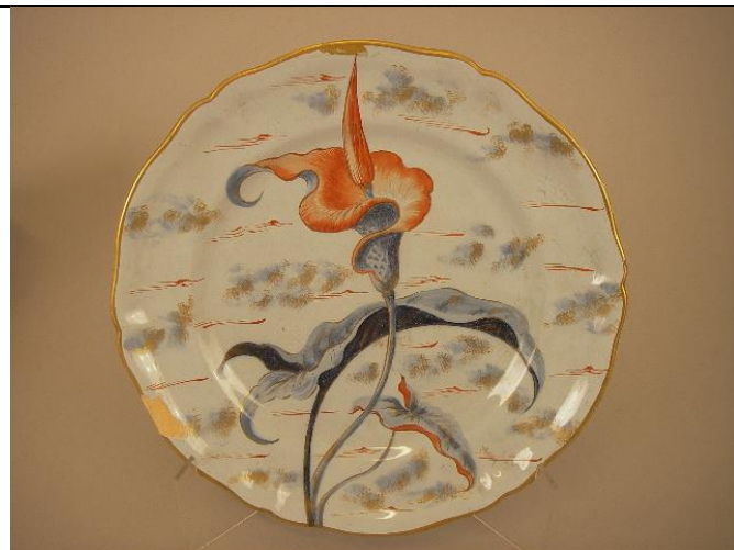
Inv. 989.2.16. Assiette service Floral.