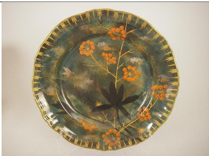
Inv. 278J. Assiette au décor de baies orangées.

Enfin, les œuvres d'Émile Gallé tranchent complètement avec les anciens moules privilégiés par son père. Sans oublier le contexte des Expositions (qui aident l'affaire Gallé à faire son chiffre d'affaire, par le renouvellement des commandes, surtout autour des « objets de luxe ») qui demandent de redoubler d'efforts pour surprendre le public d'amateurs et de connaisseurs, les œuvres réalisées n'ont plus rien à voir avec des assiettes blanches structurées par un marli ajouré. Les influences se croisent pour sublimer le symbolisme d'Émile Gallé, et rendre hommage à la matière de confection (la faïence), à la forme dont l'usage est bouleversé, aux motifs ornementaux ( Annexes 43 et 44 ).