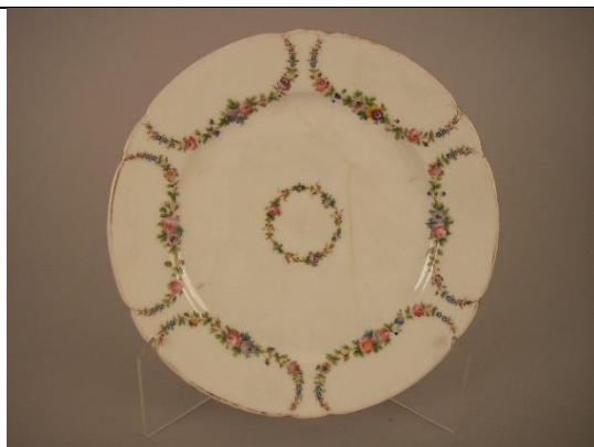
Inv. AS82. Assiette en porcelaine au décor polychrome.

Par exemple, l'on peut regarder de la porcelaine, mise à jour sous la direction de Charles Gallé, selon des méthodes d'ornementation différentes ( Annexes 39 et 40 ) :