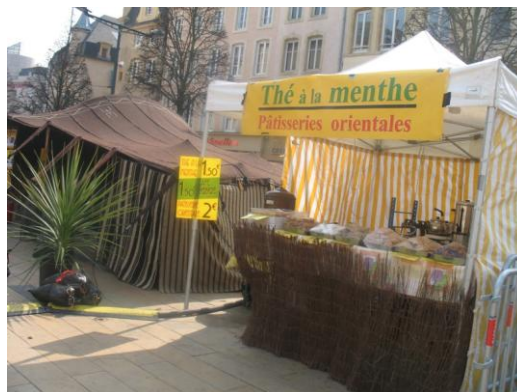
La tente africaine sur la Place du Marché

Tirant les leçons des deux expériences précédentes, l'équipe organisatrice va s'efforcer d'améliorer la visibilité du Festival dans l'espace public, en rendant sensible la rupture qu'il introduit dans l'expérience quotidienne de la ville. Dans ce dessein, la municipalité de Thionville a décidé d'édifier des lieux propres au festival, dont le lieu central qu'est le Magic Mirror . Il s'agit d'une salle de bal raffinée mobile, avec un parquet de danse et des miroirs tout autour de la piste. Cette structure sera implantée place André Malraux durant toute la durée du festival. On y organisera la soirée d'ouverture, le salon littéraire et certaines conférences avec des invités particulièrement prestigieux, tel Régis Debray, qui a accepté de venir dialoguer avec Michel Foucher. Par ailleurs, une Tente africaine , installée Place du Marché, servira de lieu de spectacle et d'animation, en même temps qu'elle rendra sensible au passant, en tant qu'objet exotique, le dépaysement organisé par le festival et le contact avec l'étranger dont il offre l'occasion.