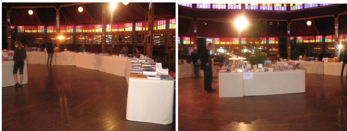
La lisière au Magic Mirror