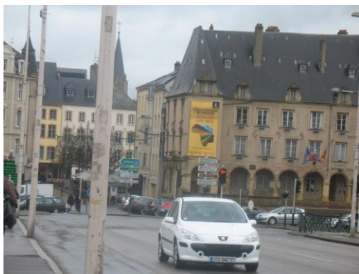
La mairie de Thionville vue du Pont des Alliés