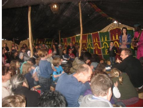
Tente africaine. Spectacle de contes. Samedi à 16h

Certains spectacles, comme les contes africains, le spectacle de danse ou les spectacles déambulatoires ont particulièrement touché un public familial de parents saisissant l'occasion d'offrir à leurs jeunes enfants un spectacle de qualité adapté à leur âge. La tente africaine installée Place du Marché a été ainsi prise d'assaut lors du spectacle de contes africains qui y a été donné. Une grand-mère rencontrée à cette occasion avait découvert le matin même dans la presse locale — le Républicain Lorrain — l'annonce du spectacle et immédiatement décidé de « de faire une sortie familiale, avec mes petit enfants, c'est gratuit, ce sont des contes et c'est en plein air. »