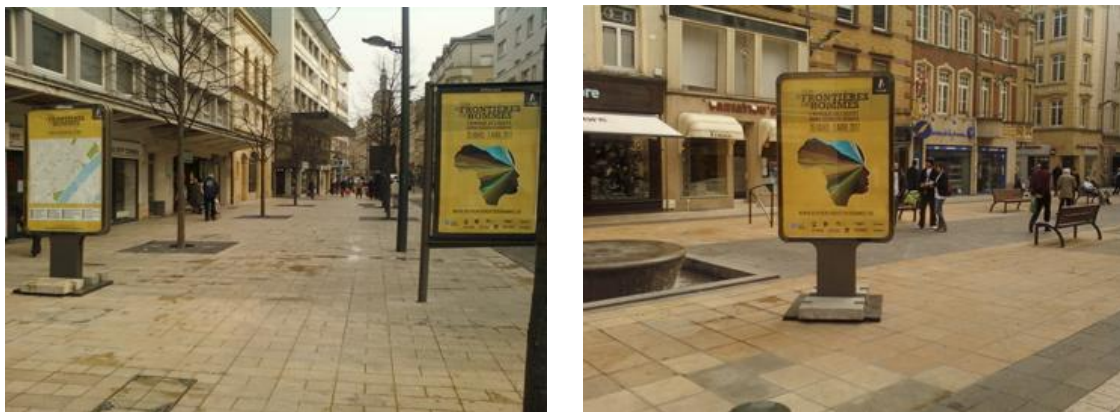
Entrée dans le centre piétonnier par la Rue Brulée

Il s'agit de donner à la ville un aspect festif, un « air d'Avignon en période de festival » comme une spectatrice satisfaite l'indique à la directrice.