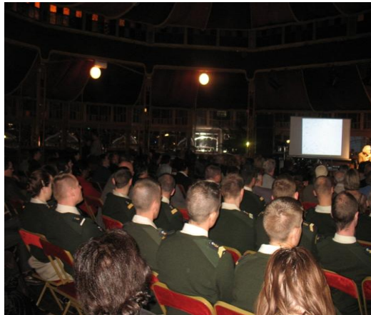
Magic Mirror. La Table ronde d'ouverture et la présence du 40 ème RT

« J'ai trouvé les conférences un peu trop généralistes, pas assez précises, et trop orientées à gauche ».