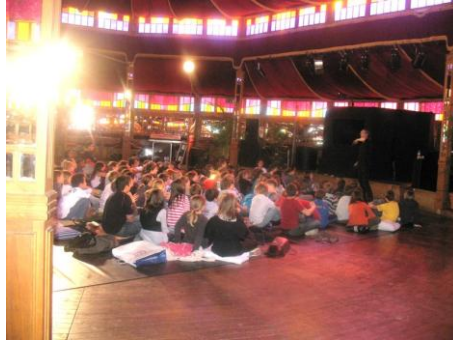
Spectacle pour scolaires au Magic Mirror

Un partenariat avec les collèges et lycées thionvillois a été développé en amont du festival. Le club Mali du collège de La milliaire a ainsi été sollicité pour participer à une rencontre à la bibliothèque, les collèges et école primaires pour un spectacle de marionnettes sur le recyclage et aussi pour les expositions. Une préparation avec les professeurs a été mise en place avec des activités ciblées en fonction de l'âge des élèves. Le club Mali est très investie, comme le souligne son animatrice, la documentaliste du collège La milliaire :