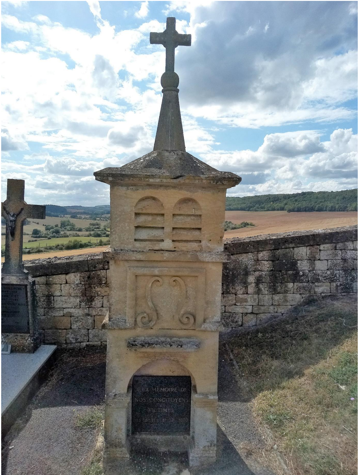
5 « À la mémoire de nos concitoyens victimes des 16/11 et 11/12/1870 », monument dans le cimetière de Thonne-les-Prés.