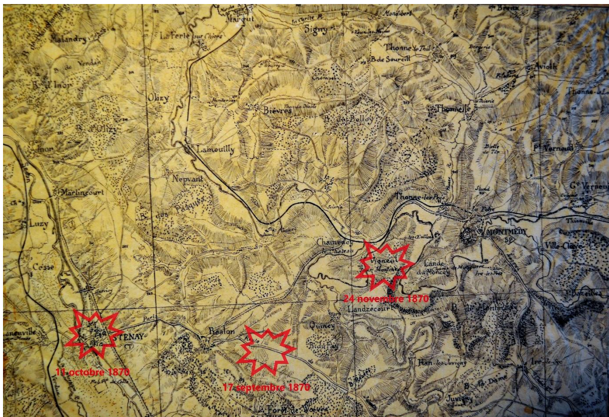
4 Secteur couvert par la garnison de Montmédy lors du siège avec, en rouge, ses principaux coups de main. Fonds de carte : SHD, L n 5.