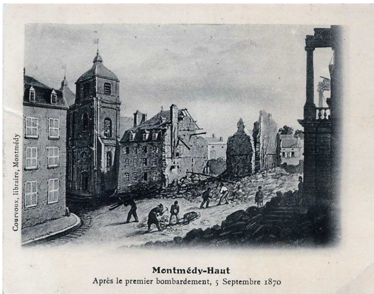
3 Carte postale.