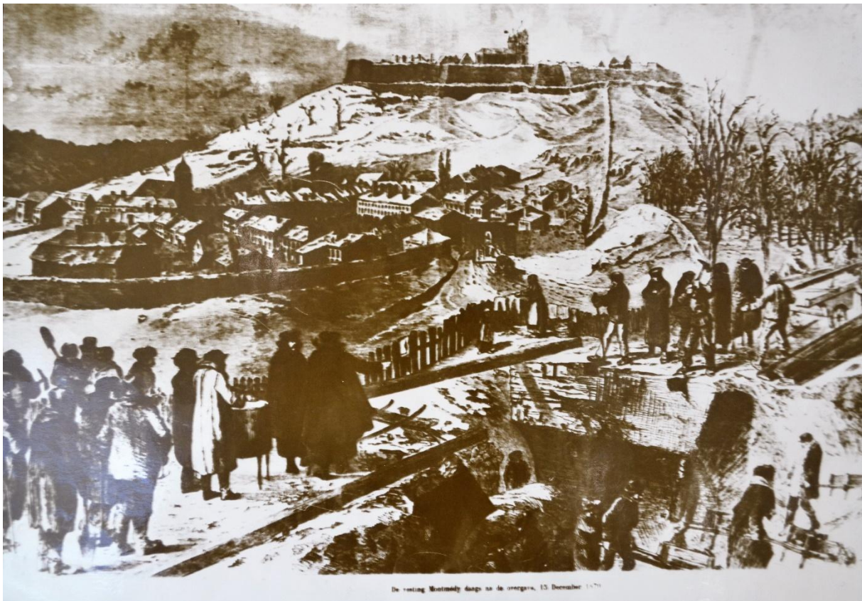
7 Vue sur Montmédy le 15 décembre 1870. AD 55, 270 J 334.