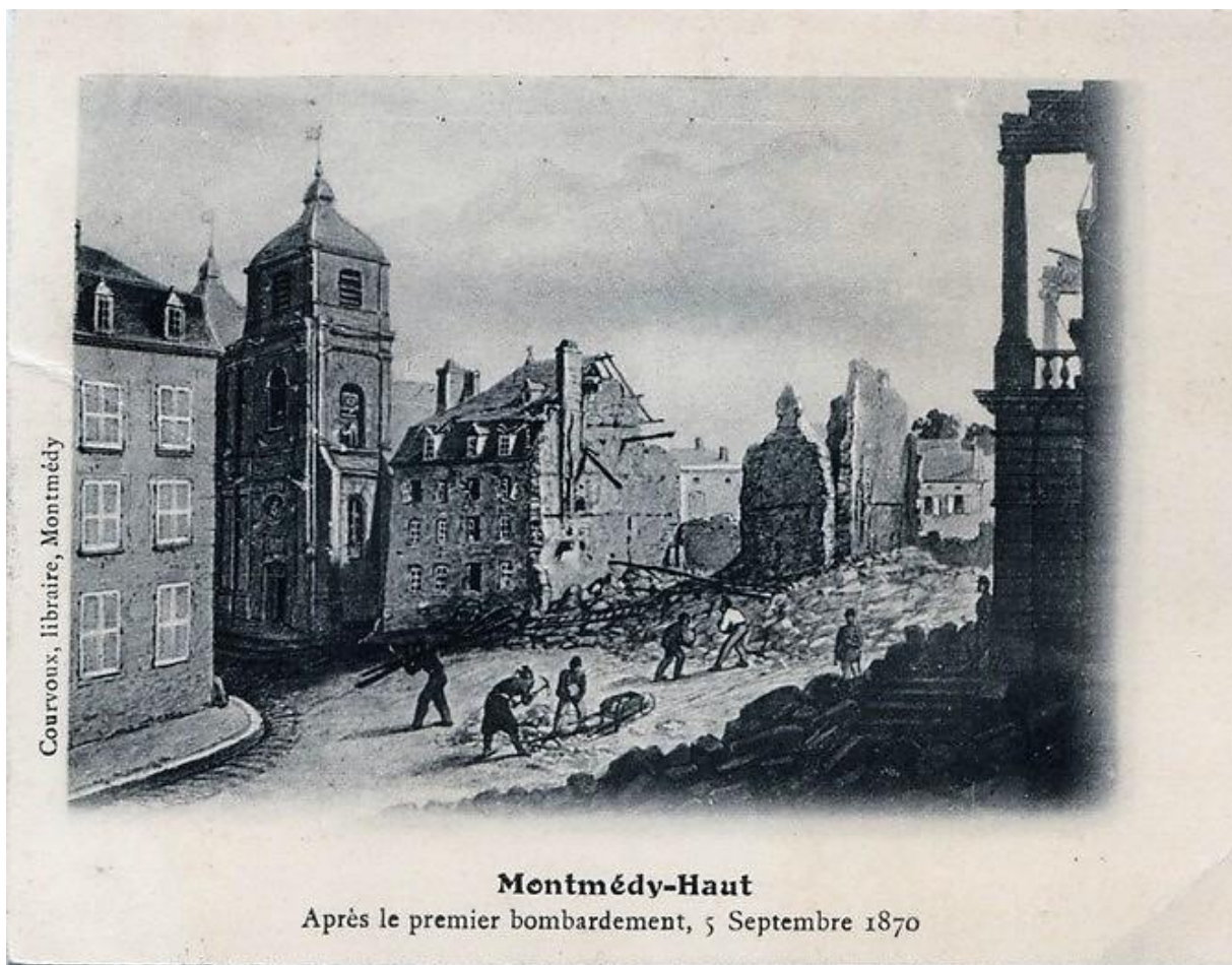
3 Carte postale.