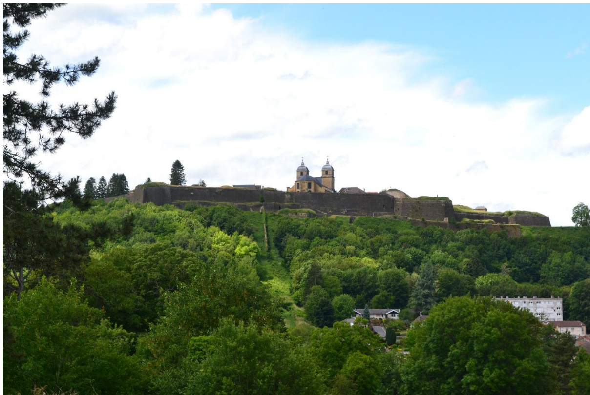
1 La citadelle de Montmédy.

Le 27 juillet 1870, Montmédy était déclarée en état de guerre. Malgré ses fortifications anciennes et son armement insuffisant 1 , cette place forte a été mise en situation de défense. Sa garnison, composée de troupes du 57 e régiment d'infanterie de ligne et commandée par le capitaine Louis Claude Reboul, a été renforcée par :