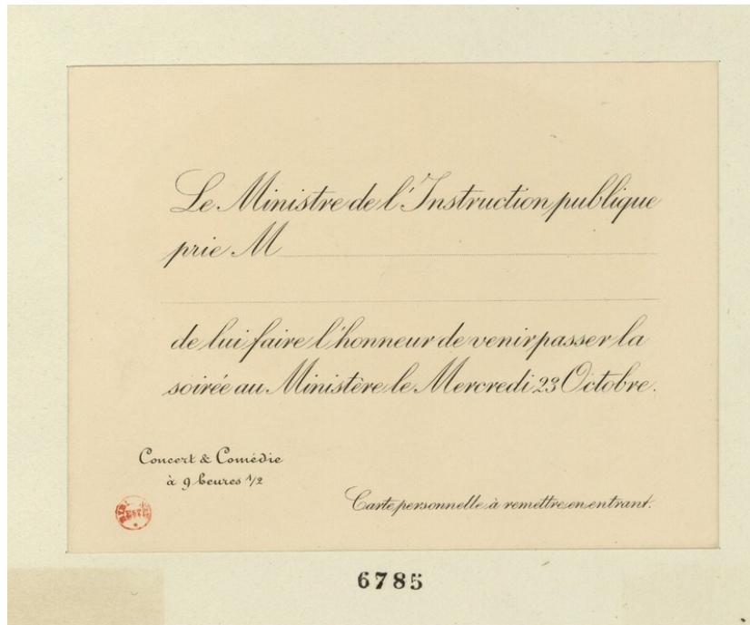
Figure 3 - Carte personnelle d'invitation au Ministère

La Bibliothèque de l'Institut conserve sous les cotes 1370 à 1383 les documents relatifs aux festivités du centenaire de l'institution dont elle préserve la mémoire. Inutile de chercher l'équivalent dans les archives du Bureau des longitudes. Ses ambitions commémoratives ont fondu comme neige au soleil : exit la séance publique, exit les médailles.