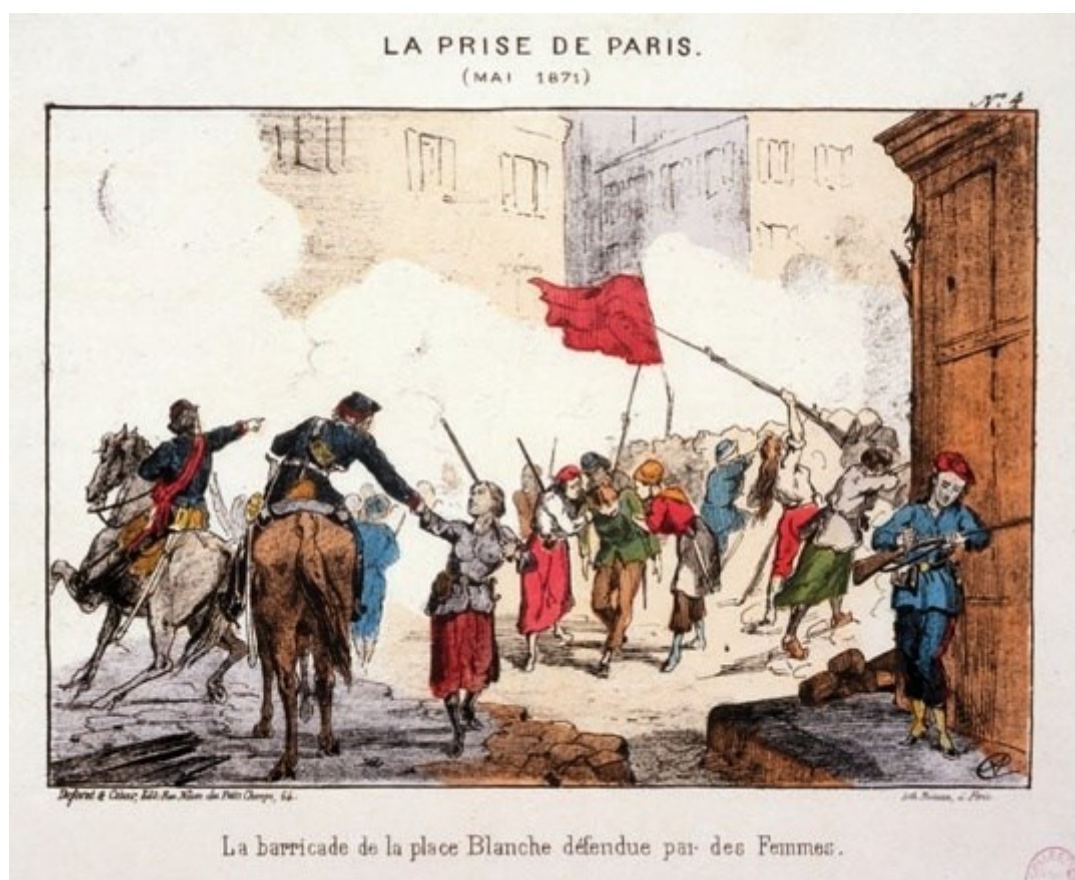
Figure 1 - La barricade de la place Blanche défendue par des femmes lors de la Semaine sanglante. Lithographie, musée Carnavalet, Paris. XIXe siècle

Du 18 mars au 28 mai 1871, Paris est le théâtre de l'insurrection de la Commune, écrasée par les Versaillais lors de la « Semaine sanglante ». Pendant celle-ci, les insurgés se réfugient à l'Observatoire où un incendie se déclare.