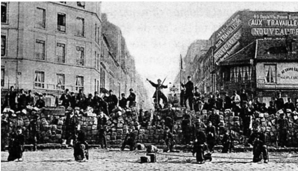
Figure 3 - Une barricade de la Commune de Paris, le 18 mars 1871

« While I was mousing among the old records of the Paris Observatory, the city was under the reign of the Commune and besieged by the national forces. The studies had to be made within hearing the besieging guns » (p. 321)